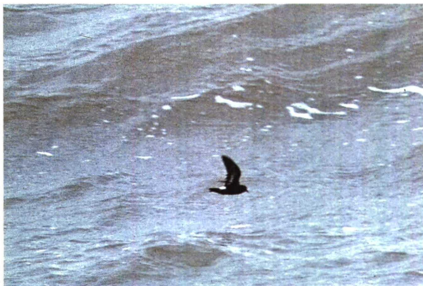
185-186 Stormvogeltje Hydrobates pelagicus , IJmuiden, Noordholland, september 1990 (Arnoud B van den Berg)