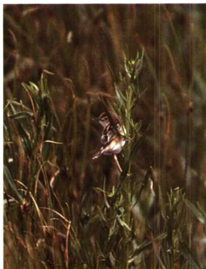
192 Graszanger Cisticola juncidis , Paal, Zeeland, augustus 1990