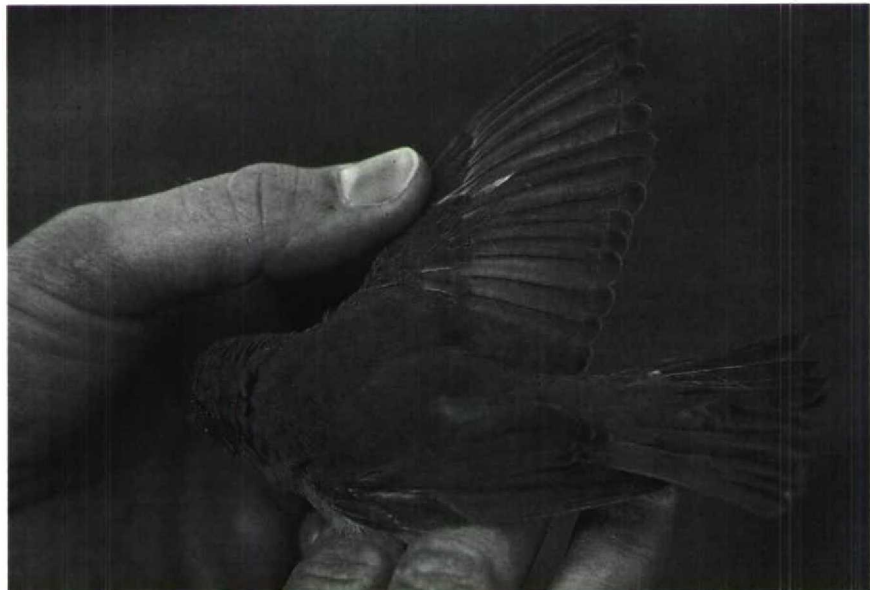
177 Garden Warbler Sylvia borin , first-year, Bloemendaal, Noordholland, October 1988

Mystery photograph 38, Berlengas, Portugal, June 1984. Solution in next issue.