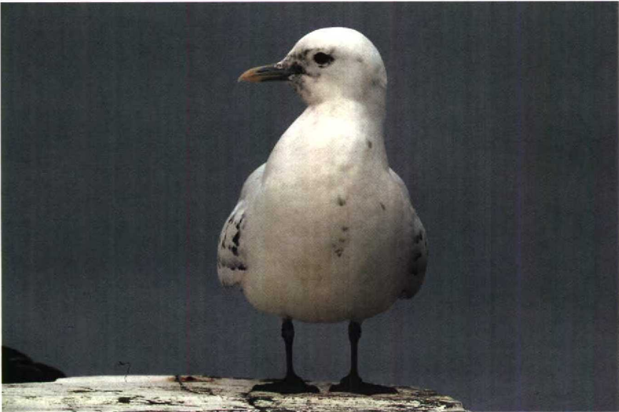
172 Ivoormeeuw Pagophila eburnea , Stellendam, Zuidholland, februari 1990

GEDRAG Zeer mak. Op visafval afkomend en daarbij dominant over andere meeuwen.