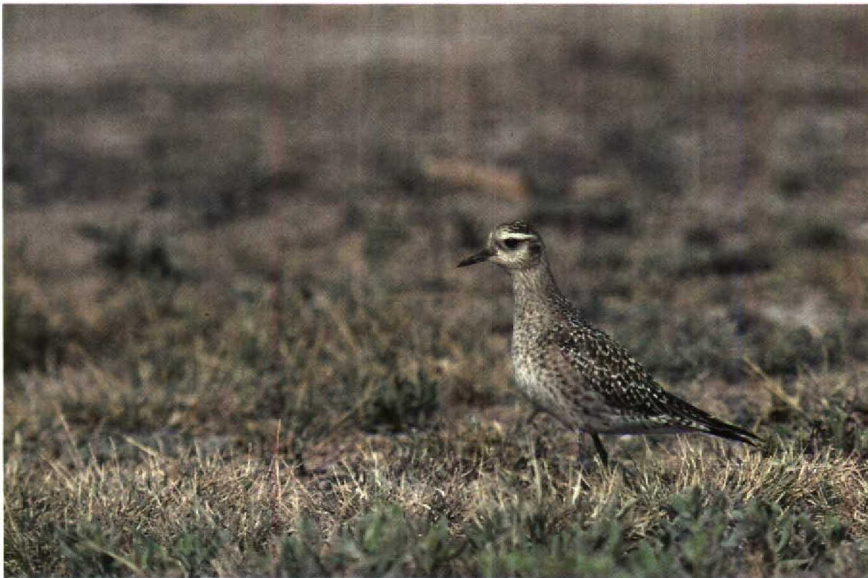
162 P. dominica , Texas, USA, March 1982 (Arnoud B van den Berg)

According to Dunn et al (1987), P. dominica and P. fulva differ in the number of primaries exposed beyond the tertials, with four or five in P. dominica and three in