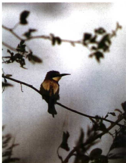
191 Bijeneter Merops apiaster , Schiermonnikoog, Friesland, september 1990 (Leo J R Boon)