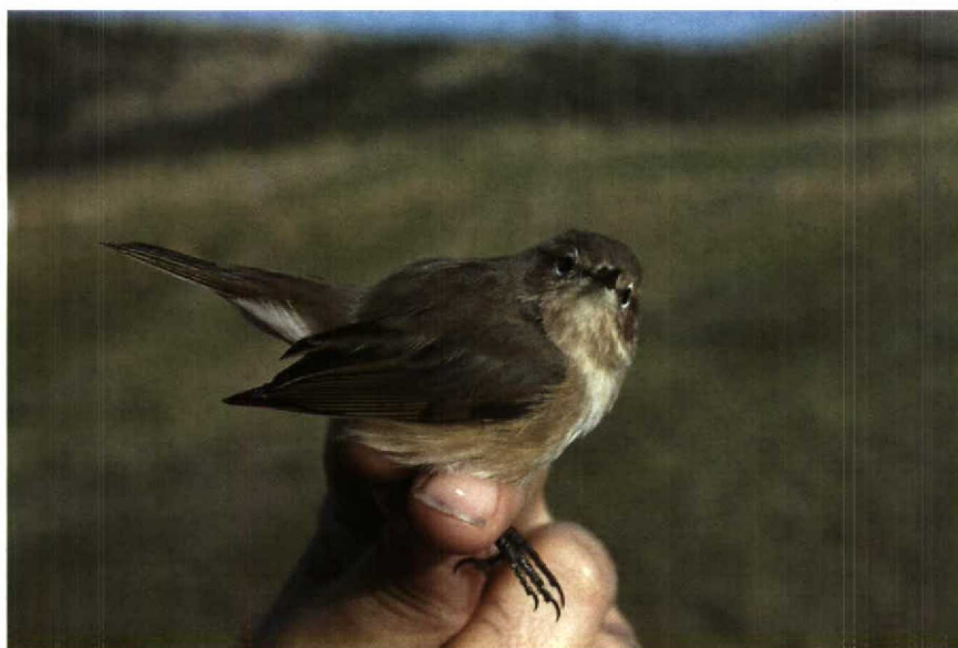
193 Tjiftjaf Phylloscopus collybita met kenmerken van Siberische ondersoort P c tristis , Bloemendaal, Noordholland, oktober 1990 (Arnoud B van den Berg)