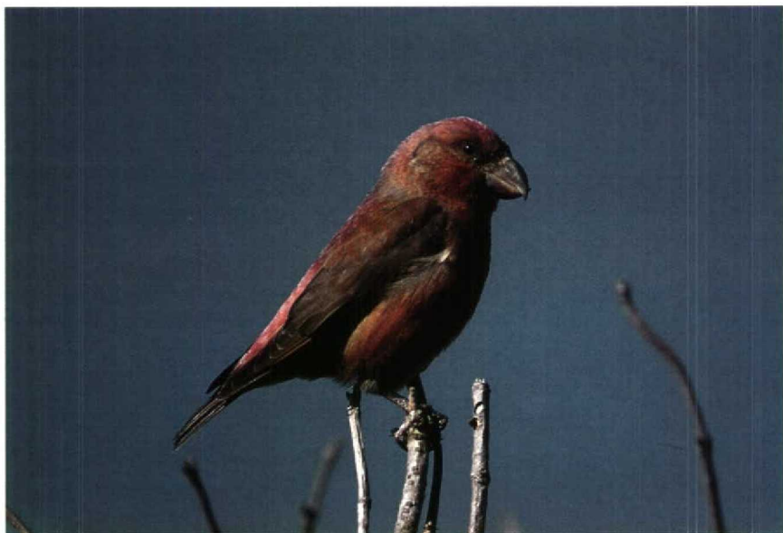
201 Grote Kruisbek Loxia pytyopsittacus , Kennemerduinen, Noordholland, oktober 1990 (Piet Munsterman) 202 Kleine Goudplevier Pluvialis fulva , Abbega, Friesland, november 1990 (Joop Jukema)