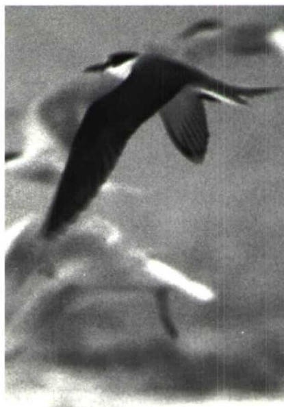
170-171 Brilsterne Sterna anaethetus , IJmuiden, Noordholland, juli 1989 (Arnoud B van den Berg)

Brilsterne, Bonte Sterne S fuscata en Grijsrugsterne S lunata . De Bonte Sterne verschilt van beide anderen door donkerdere bovendelen, met name mantel en nek, die niet opvallend lichter zijn dan de vleugels, en door een andere vorm van het wit op het voorhoofd. Dit reikt bij Bonte Sterne niet in een punt naar achteren voorbij het oog zoals bij Brilsterne en Grijsrugsterne. De Grijsrugsterne, die in zijn verspreiding beperkt is tot het Pacifische gebied, lijkt sterk op de Brilsterne, doch verschilt vooral door nog lichtere mantel en rug en doordat alleen de buitenste staartpen wit is (Harrison 1983, 1987). Dit laatste is ook het geval bij de Bonte Sterne maar de Atlantische ondersoort van de Brilsterne heeft meer wit in de staart.