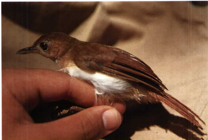
132 Ferruginous Babbler Trichastoma bicolor , Lunang, West Sumatra, Indonesia, July 1981