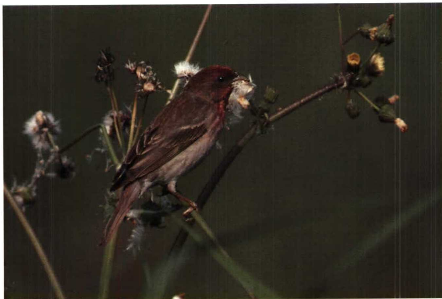
158 Roodmus Carpodacus erythrinus , Oostvaardersplassen, Flevoland, juni 1990 159 Dwerggors Emberiza pusilla , Katwijk, Zuidholland, april 1990