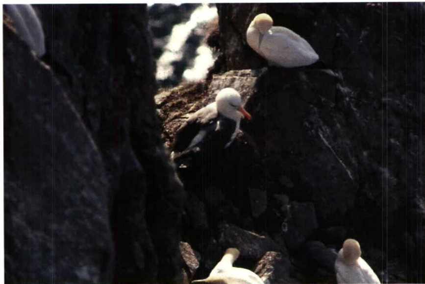
139 Black-browed Albatross Diomedea melanophris , Hermaness, Unst, Shetland, Britain, April 1987

caught there on 19 and 23 July 1989 (Birding World 2: 288-289, 1989). For more information on the possible identity of these dark-rumped fork-tailed petrels with pale bases to the primary shafts, see Birding World 3: 249, 1990. This was an outstanding year for the breeding of Greater Flamingos Phoenicopterus ruber in the western Mediterranean, with a colony in France (Camargue, Bouches-du-Rhône, 6000-7000 young), a colony in Spain (Fuente de Piedra, Málaga, 10 000-12 000 young) and two colonies in Tunisia (Chott Fedjaj, 3000 young, and Chott el Guethar, 300 nests with eggs). The American Black Duck Anas rubripes at Loch of Spiggie, Shetland, Britain, remained until at