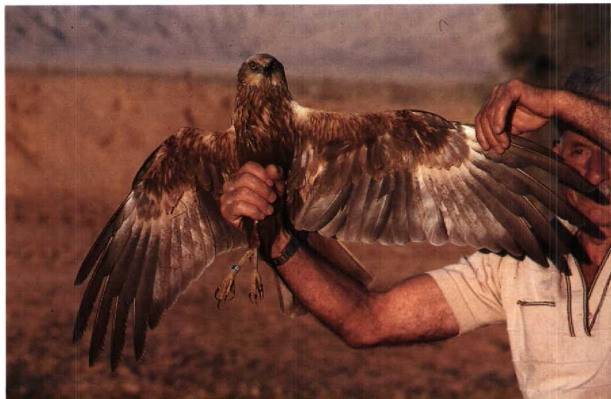
125 Marsh Harrier Circus aeruginosus , subadult male, showing streaked breast-pattern (like adult male) and restricted whitish patch on underwing. Note adult female-like face-pattern. Eilat, Israel, April 1986 ( William S Clark ) 126 Marsh Harrier Circus aeruginosus , subadult male (same as plate 122), showing large whitish patch on underwing. Note dark terminal band on remiges. Eilat, Israel, April 1986 ( William S Clark )