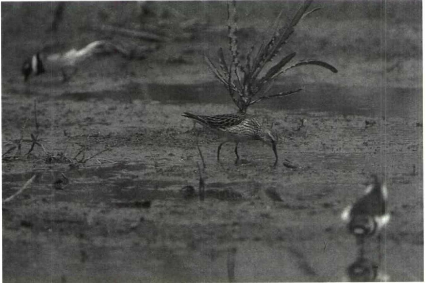
143 White-rumped Sandpiper Calidris fuscicollis , Nörten-Hardenberg, Niedersachsen, FRG, May 1990 144 Greenish Warblers Phylloscopus trochiloides , Helgoland, Schleswig-Holstein, FRG, July 1990