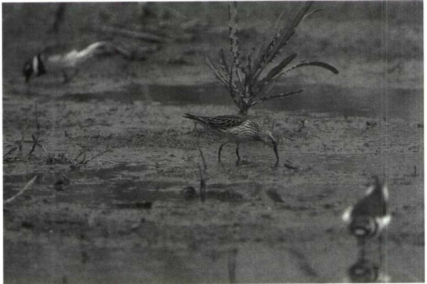
143 White-rumped Sandpiper Calidris fuscicollis , Nörten-Hardenberg, Niedersachsen, FRG, May 1990 144 Greenish Warblers Phylloscopus trochiloides , Helgoland, Schleswig-Holstein, FRG, July 1990