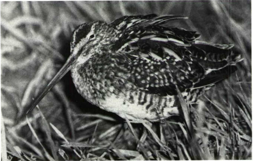
134 Snipe Gallinago gallinago , Randwijk, Gelderland, March 1990

Mystery photograph 37. Solution in next issue.