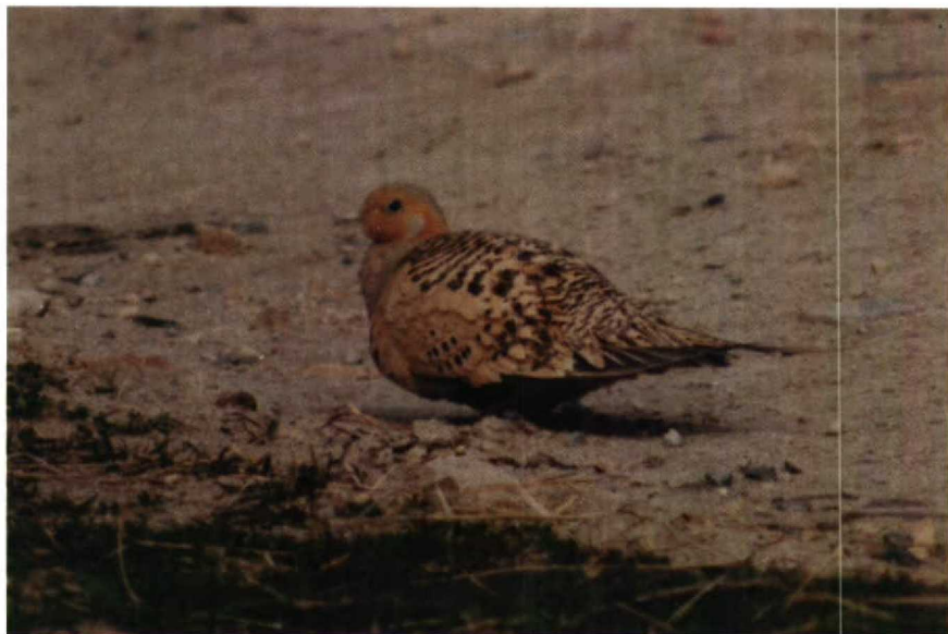
140 Pallas's Sandgrouse Syrrhaptes paradoxus , Loch of Hillwell, Shetland, Britain, May 1990 141-142 Tree Swallow Tachycineta bicolor , Porth Hellick Pool, St Mary's, Scilly, Britain, June 1990