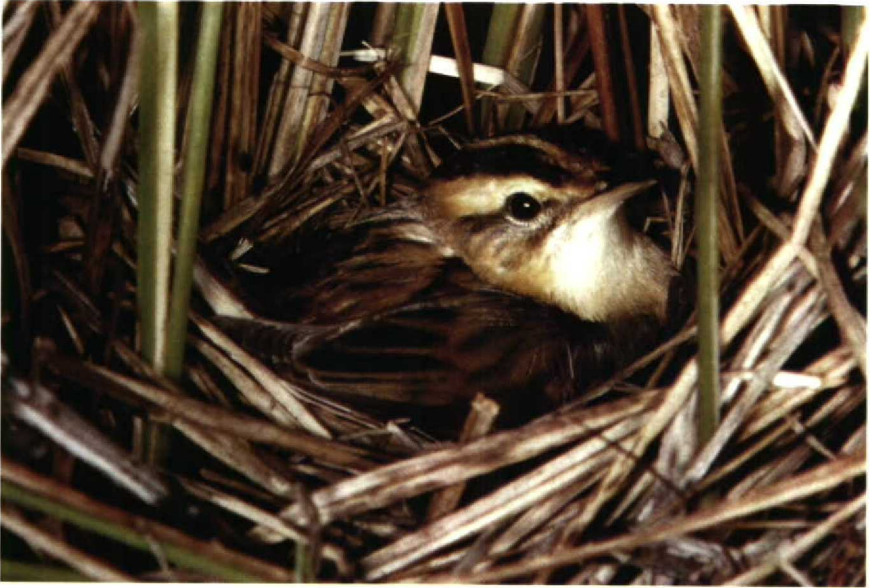
116-117 Aquatic Warbler Acrocephalus paludicola , Biebrza lowlands, Poland (Andrzej Balinski)