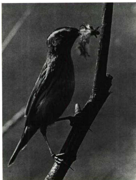
120 Aquatic Warbler Acrocephalus paludicola , Biebrza lowlands, Poland (Andrzej Balinski)

In comparison with other countries, the records of 181 lighthouse victims from the Netherlands are interesting as they give an indication of abundance earlier this century. They account for 30% of the total of Dutch records and occurred between 1887 and 1971, with 1912 (31) and 1936 (53) as peak years. Since 1950, only 20 lighthouse victims have been found. Both geographically (figure 1) and temporally