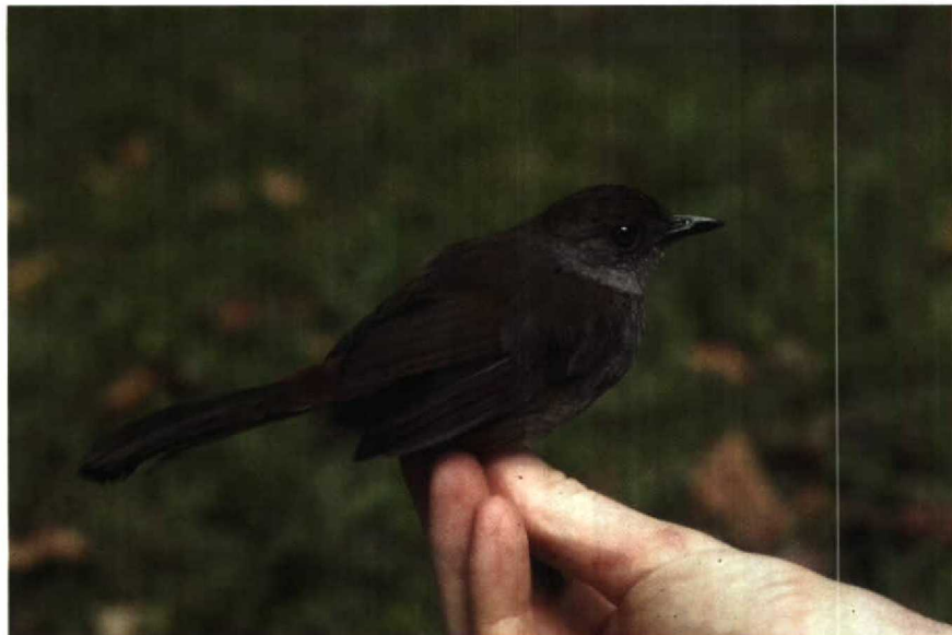
130 Bagobo Babbler Leonardina woodi , Baracatan Eagle Camp, Mount Talomo, Davao, Mindanao, Philippines, March 1985 ( Jelle Scharringa ) 131 White-chested Babbler Trichastoma rostratum , Sepilok Forest Reserve, Sabah, Malaysia, December 1982 ( Frank Rozendaal )