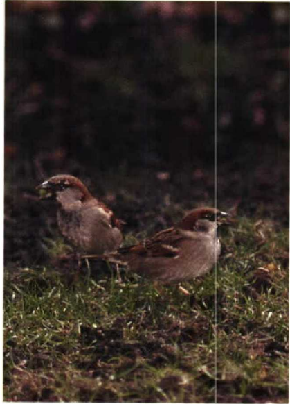
128-129 Hybride Huismus x Ringmus Passer domesticus x P. montanus , Aalsmeer, Noordholland, februari 1990 (Arnoud B van den Berg)

onder het zwarte 'slabbetje' bevonden zich slechts enkele donkere schubjes, kleine witte vlekjes waren aanwezig voor en achter boven het oog, er was een dun achterste vleugelstreepje en de donkere wangvlek was, hoewel niet zwart, iets contrasterender dan op Tucker's plaat. Geheel in overeenstemming waren een wit voorste vleugelstreepje, de bruine stuit, de zeemkleurige onderdelen en de niet in de nek doorlopende witte halsring.