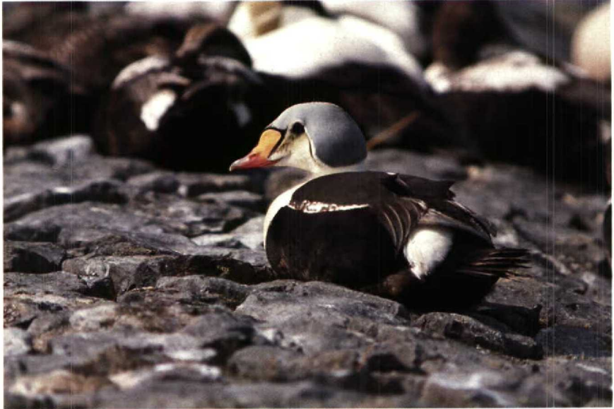
147 Koningseider Somateria spectabilis , Harlingen, Friesland (Allen Liosi) 148 Roodpootvalk Falco vespertinus , Zuidelijk Flevoland, Flevoland, mei 1990 (Allen Liosi)