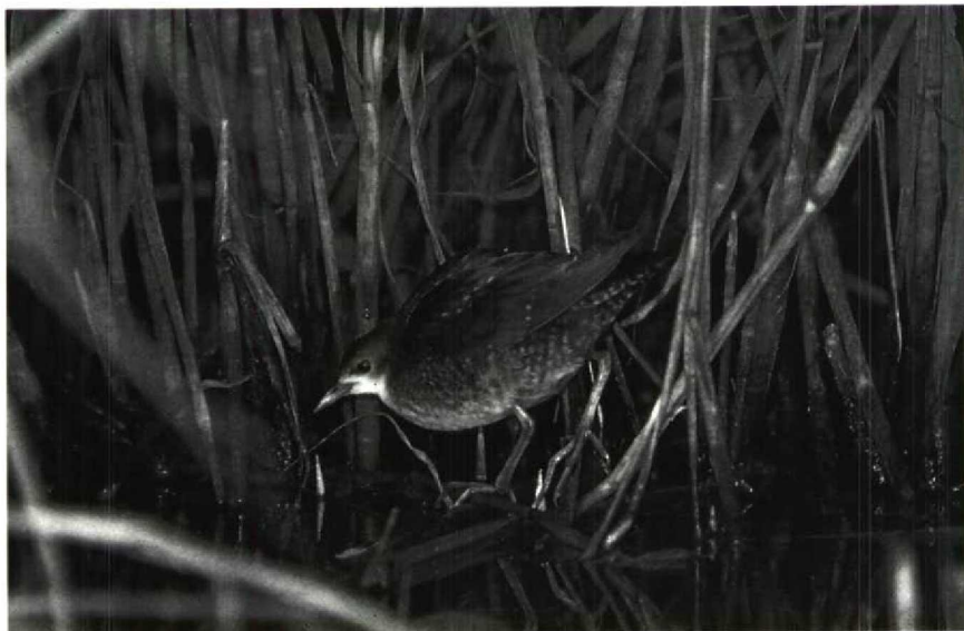
160 Klein Waterhoen Porzana parva , Eemshaven, Groningen, augustus 1990 ( Rein Hofman ) 161 Vorkstaartmeeuw Larus sabini , Oostvaardersdijk, Flevoland, september 1990 ( Hans Gebuis ). Vanaf 14 september tot en met 17 september 1990 verbleef deze juveniele vogel langs de Oostvaardersdijk, veelal foeragerend in de wegberm of zelfs op het wegdek.