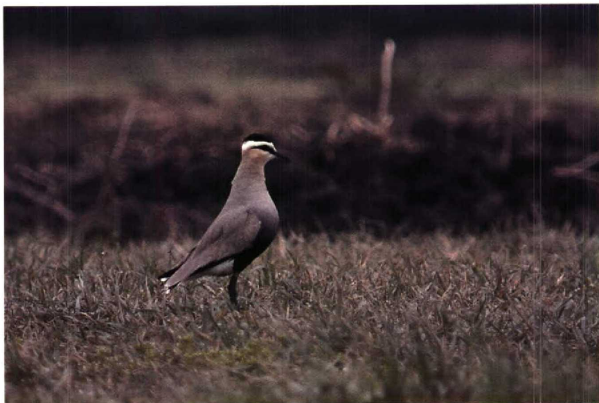
151 Steppiekievit Chettusia gregaria , IJsselstein, Utrecht, april 1990