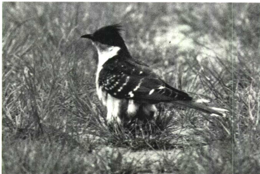
157 Kuifkoekoek Clamator glandarius , Hellevoetsluis, Zuidholland, mei 1990

trum van Delft Zh gezien. Bij Lies op Terschelling Fr werd op 10 juni een Roodsterblauwborst Luscinia svecica svecica geobserveerd. Een roodstaart Phoenicurus die eind mei-begin juni in Harlingen zat werd door sommigen uitgemaakt voor een hybride Zwarte Roodstaart Pochrus x Gekraagde Roodstaart P phoenicurus en door anderen voor een gewone, afwijkende Gekraagde Roodstaart. Cetti's Zangers Cettia cetti zaten vanaf 14 april bij Harchies (vanaf 23 mei twee aldaar) en in mei bij Hautrage Hg. Voor het eerst sinds jaren was er weer een broedgeval van de Graszanger Cisticola juncidis – (de 'Zip') – in Nederland. Vanaf 24 juli werd een paar, later met jongen, waargenomen tussen Kruispolderhaven en gemaal Paal in Zeeuws-Vlaanderen Z. Er waren maar liefst vier gevallen van Krekeltzangers Locustella fluviatilis . In de Brabantse Biesbosch Nb van 13 tot 24 mei, langs de Ooievaarsweg Fl van 4 tot 10 juni, in het Wilgenreservaat langs de Knardijk van 6 tot 21 juni en langs de Oostvaardersdijk op 30 juni. De eerste twee Waterrietzangers Acroce-