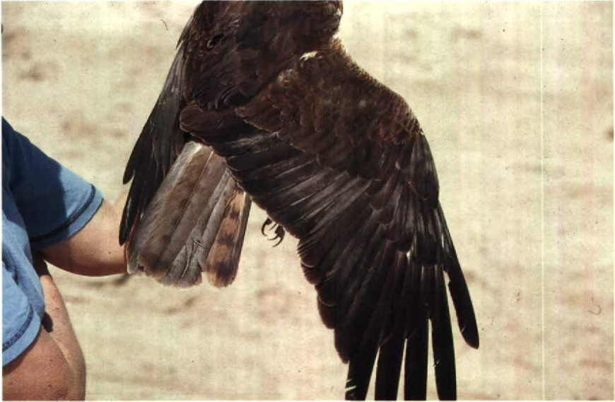
123 Marsh Harrier Circus aeruginosus , subadult male, showing mostly grey tail with dark subterminal band and hints of other bands, and outer rectrices showing rufous inner webs and dark banding. Eilat, Israel, March 1984 ( William S Clark ) 124 Marsh Harrier Circus aeruginosus , subadult male, showing grey central rectrices and others mostly rufous with faint banding. Eilat, Israel, March 1985 ( William S Clark )