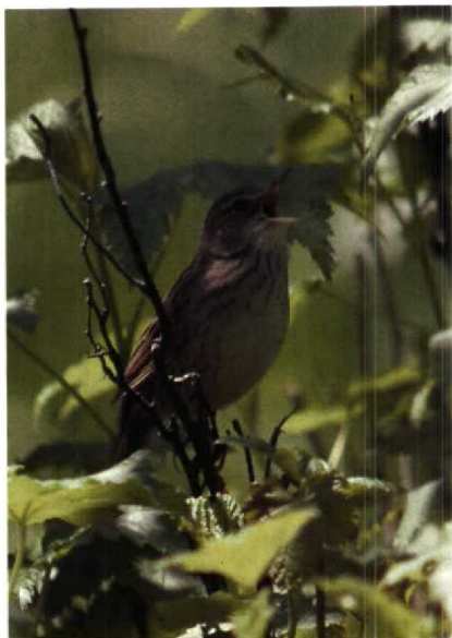
135-136 Lanceolated Warbler Locustella lanceolata , Irkutsk, USSR, June 1985 (Huub Huneke) 137 Pallas's Grasshopper Warbler Locustella certhiola , Bratsk, USSR, June 1985 (Huub Huneke)