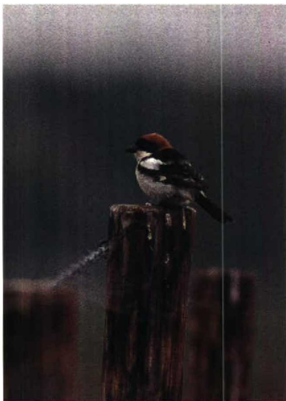
154 Krekelzanger Locustella fluviatilis , Brabantse Biesbosch, Noordbrabant, mei 1990 155 Roodkopklauwier Lanius senator , 's-Hertogenbosch, Noordbrabant, juni 1990 156 Struikrietzanger Acrocephalus dumetorum , Lelystad, Flevoland, juni 1990