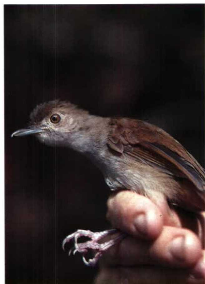
133 Sulawesi Babbler Trichastoma celebensis , Dumago-Bone NP, North Sulawesi, Indonesia, October 1981