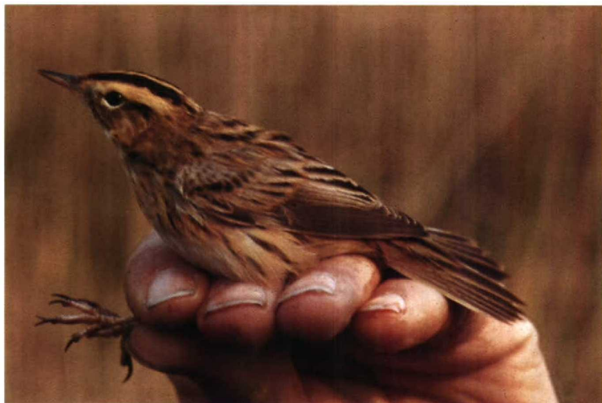
118-119 Aquatic Warbler Acrocephalus paludicola , Ruigoord, Noordholland, April 1978