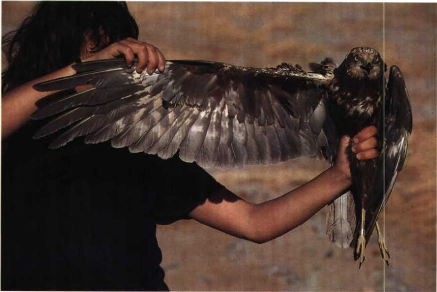
127 Marsh Harrier Circus aeruginosus , subadult male (same as plate 121), showing dark breast with pale patch (like adult female) and dark underwing-coverts. Note extensive whitish mottling on underwing. Eilat, Israel, April 1985 (William S Clark)

with 3-6 dark brown bands across each feather. This tail-banding has been illustrated (albeit on folded tails) and described by Forsman (1984). The iris colour is lemon-yellow like the adult male.