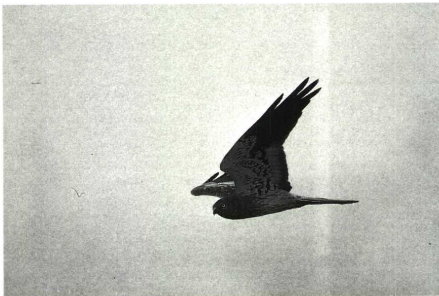
149 Grauwe Kiekendief Circus pygargus , Tureluurweg, Flevoland, juli 1990 (Lammert van der Veen) 150 Kwartelkoning Crex crex , Groningen, Groningen, april 1990 (Leo J R Boon)