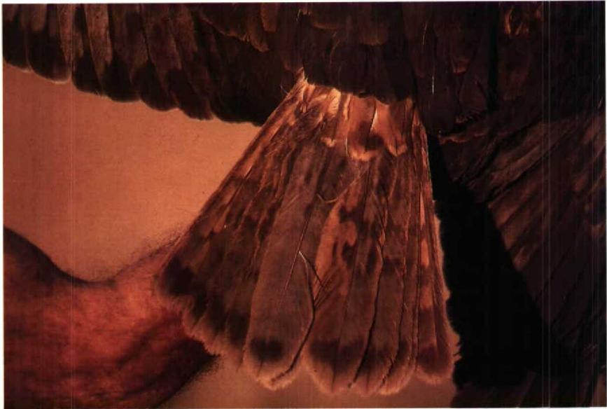
122 Marsh Harrier Circus aeruginosus , subadult male, showing rufous-and-grey coloration with dark subterminal tail band and faint banding. Eilat, Israel, April 1986

white illustrations. Here we describe the subadult male plumage in detail and using photographs of birds in the hand to illustrate plumage characteristics. The birds were captured at Eilat, Israel, as part of a study of raptor migration.