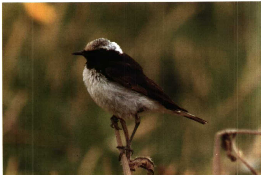
145 Pied Wheatear Oenanthe pleschanka , Newhaven, East Sussex, Britain, July 1990 ( Tim Loseby ) 146 Red-headed Bunting Emberiza bruniceps , Helgoland, Schleswig-Holstein, FRG June 1990 ( Frank Stühmer )