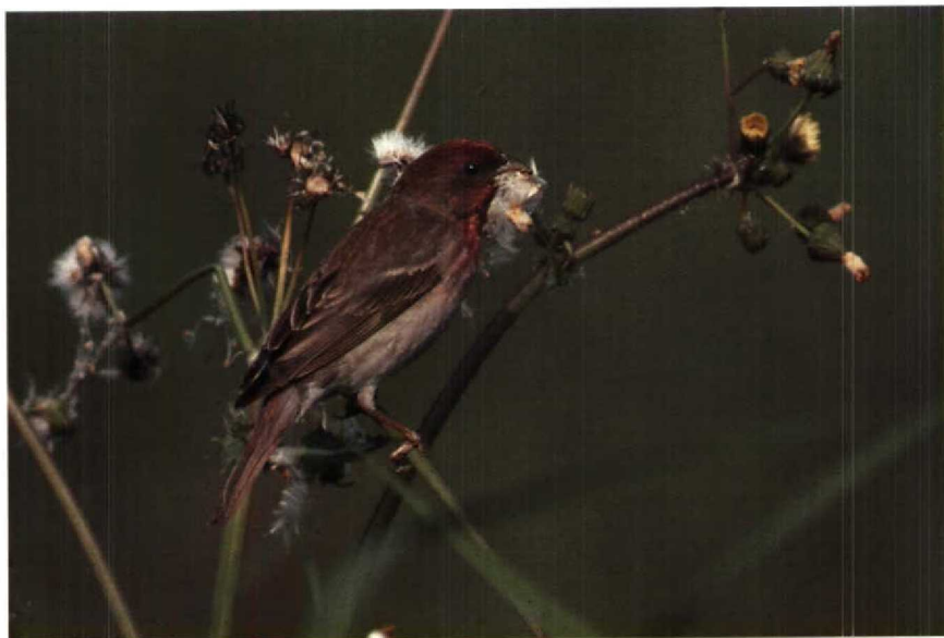
158 Roodmus Carpodacus erythrinus , Oostvaardersplassen, Flevoland, juni 1990 (René Pop) 159 Dwerggors Emberiza pusilla , Katwijk, Zuidholland, april 1990 (Arnoud B van den Berg)