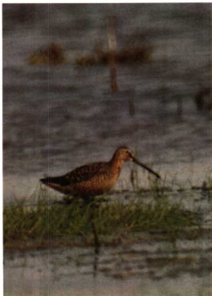
152-153 Grote Grijsze Snip Limnodromus scolopaceus , Lauwersmeer, Groningen, mei 1990 (Jaap van 't Hof)