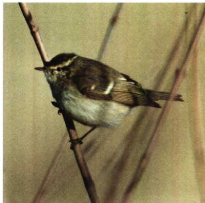
26 Hume's Warbler Phylloscopus humei , New Biggin, Northumberland, Britain, November 1989