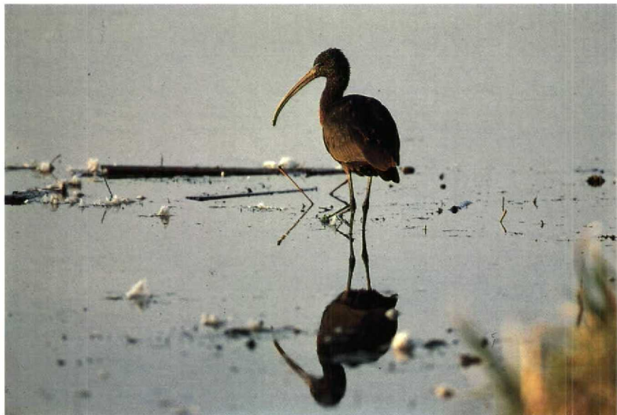
32 Zwarte Ibis Plegadis falcinellus , Nieuw-Lekkerland, Zuidholland, december 1989 33 Grote Burgemeester Larus hyperboreus , Brouwersdam, Zuidholland, oktober 1989