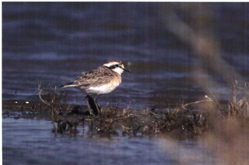
27 Kittlitz's Plover Charadrius pecuarius , Merzouga, Morocco, January 1990