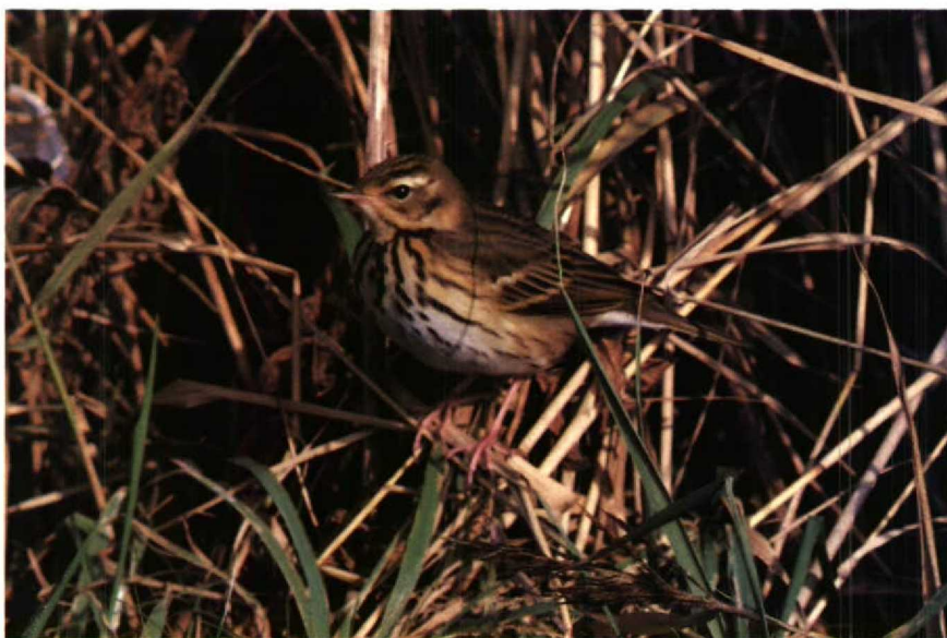
47 Siberische Boompieper Anthus hodgsoni , Texel, Noordholland, oktober 1987

KOP Voorhoofd, kruin en achterhoofd olijfgroen, kruin in lengterichting fijn zwart gestreept; zwarte wenkbrauwbevestiging. Wenkbrauwstreep voor oog warmgeel, boven en achter oog vrijwel wit; lopend van snavelbasis tot achter oorstreek, naar ach-