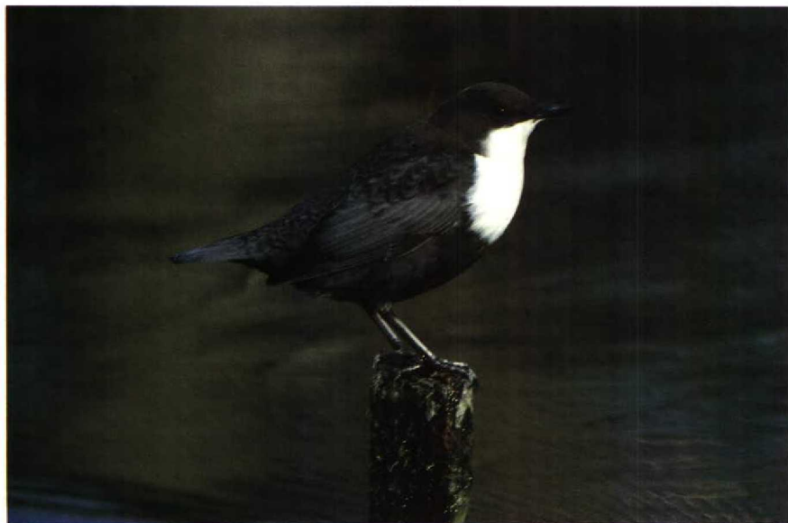
71 Waterspreeuw Cinclus cinclus , AW-duinen, Noordholland, januari 1989

den we hier dat op 23 december jl. een Oehoe Bubo bubo werd gevonden bij Berg en Terblijt L. Een Hop Upupa epops werd gezien op 28 maart in de Carnisse Grienden Zh. Op 27 maart werd een Grijskopspecht Picus canus gemeld bij Eupen Lk. Boerenzwaluwen Hirundo rustica poogden te overwinteren bij Nuland en bij Kortrijk Wvl (twee). Van 7 februari tot 30 april zat er een Grote Pieper Anthus richardi bij Breskens Z. In januari zat er een groepje van 80 Witte Kwikstaarten Motacilla alba alba , 10 Rouwkwikstaarten M. a. yarrellii en één Gele Kwikstaart M. flava bij Oostende. Pestvogels Bombycilla garrulus zaten 14 januari bij Haren Gr (max 27), tot 12 februari in Wateringen Zh (max vier), tot 4 maart bij Herentals A (max vier), op 2 en 3 januari bij Katwijk Zh (twee), op 23 januari bij Den Haag Zh, op 30 januari bij Schoorl Nh (twee) en van 1 tot 5 februari bij Gent Ovl (max zeven). Waterspreeuwen Cinclus cinclus waren aanwezig tot 5 maart in de AW-duinen Nh en tot 18 maart bij Velp Gld. Ver-