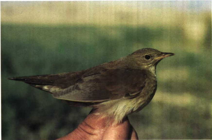
50 River Warbler Locustella fluviatilis , Elat, Israel, October 1985 (Hans Schekkerman)