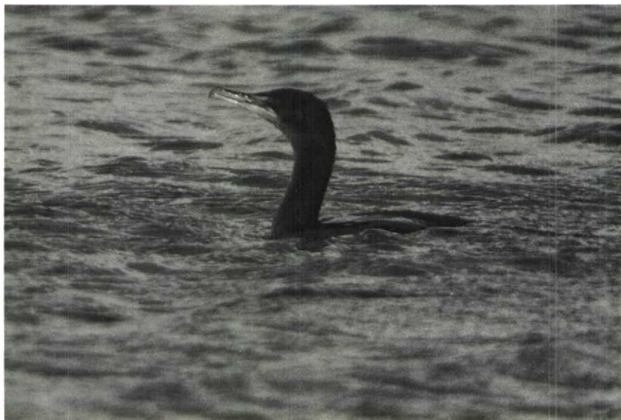
65 Double-crested Cormorant Phalacrocorax auritus , Billingham, Cleveland, Great Britain, February 1989 66 Grey-headed Gull Larus cirrocephalus , Elat, Israel, March 1989