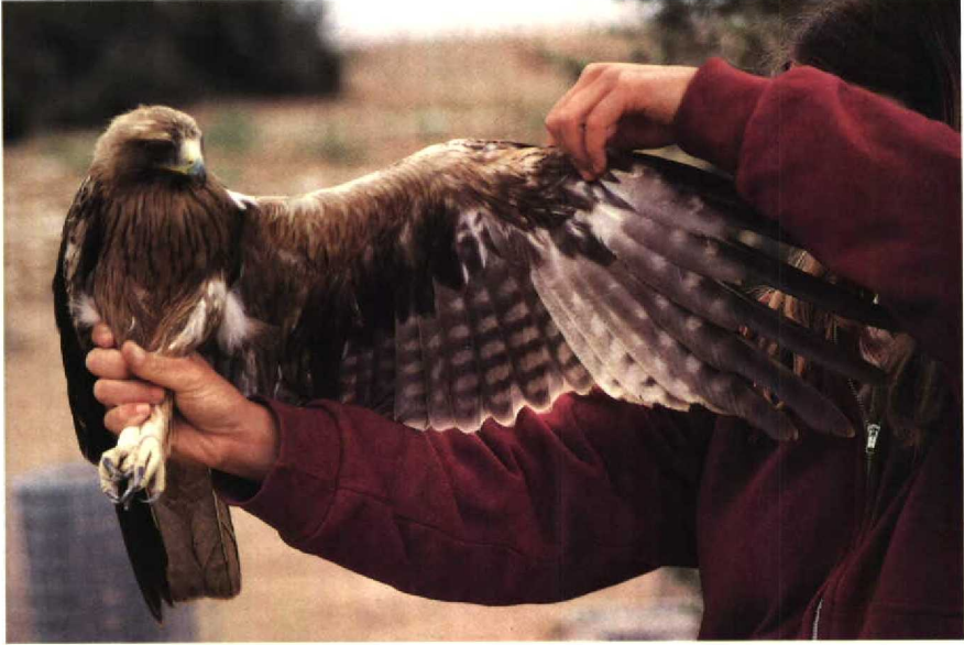
45 Booted Eagle Hieraaetus pennatus rufous morph, Elat, Israel, April 1986 (Carol McIntyre) 46 Booted Eagle Hieraaetus pennatus dark morph, Elat, Israel, April 1986 (William S Clark)