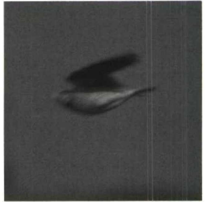
51-52 Kalanderleeuwerik Melanocorypha calandra , Texel, mei 1988 (Peter van der Wolf)

NAAKTE DELEN Iris donkerbruin. Snavel geelbruinachtig.