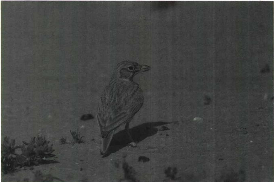
67 Dunn's Lark Eremalauda dunni , Arava valley, Israel, spring of 1989

less than 120 Houbara Bustards Chlamydotis undulata and six Arabian Bustards Ardeotis arabs were reported to be killed in the Merzouga area by Saudi Arabian falconers in December 1988. Three surviving Arabian Bustards were located in the area in early January, while another was spotted at Daya-el-Maïder on 1 January. At least 36 Great Bustards Otis tarda were assembling at Asilah Marsh in February; these birds probably belong to a small resident population in northern Morocco. On 14 March, in the Negev, Israel, a flock of 25 Caspian Plovers Charadrius asiaticus was sighted. The three Merja Zerga, Morocco, Slender-billed Curlews Numenius tenuirostris were reported to be present to at least 9 February, while at least one stayed until 11 March. An (oiled) Sabine's Gull Larus sabini flew past Oostende, Westvlaanderen, on 10 January, providing Belgium's first winter record. The long-staying Bonaparte's Gull L. philadelphia of IJmuiden, Noordholland, Netherlands, had