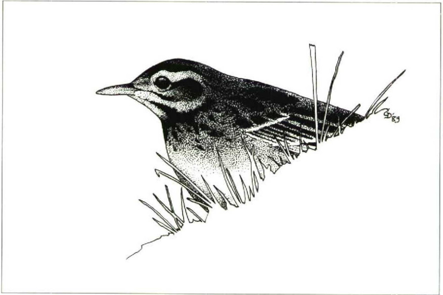
68 Golden-winged Warbler Vermivora chrysoptera , Larkfield, Kent, Great Britain, February 1989 (David M Cottridge)