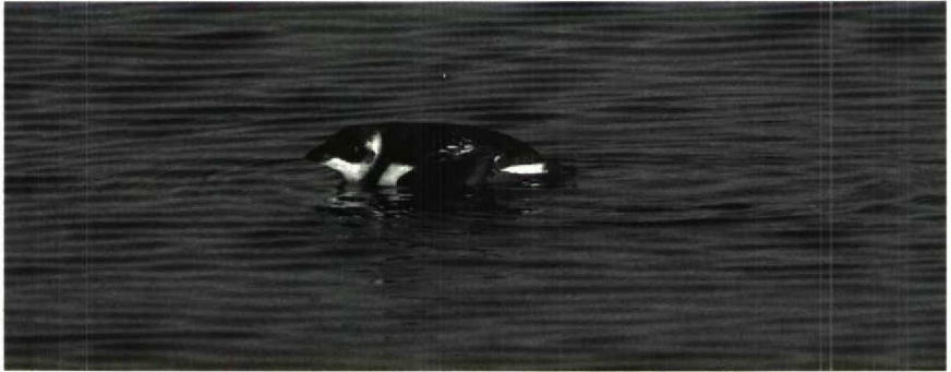
72 Kleine Alk Alle alle , Brouwersdam, Zuidholland, februari 1989

der waren er exemplaren bij Valkenburg L op 30 en 31 januari en bij Loon D begin februari. De Cetti's Zanger Cettia cetti van Harchies Hg werd daar op 8 en 15 januari zingend aangetroffen. Siberische Tijftjaffen Phylloscopus colybitta tristis waren er op 1 januari in de Wieringermeer, op 22 januari in de Brabantse Biesbosch en van 27 januari tot 4 maart bij Harchies. De Rotskruiper Tichodroma muraria werd dit jaar laat ontdekt bij Poulseur Lk en trok tussen 12 en 28 maart veel belangstelling. Taiga-boomkruipers Certhia familiaris werden gemeld in het Amsterdamse Bos Nh op 2 en 5 januari (zingend), tussen 23 en 26 februari op Schiermonnikoog en op 20 maart op Texel (zingend). Bij Kallo overwinterden