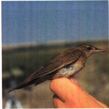
49 Savi's Warbler Locustella luscinioides with normal breast, Greece, August 1987 (Caroline van de Woestijne)