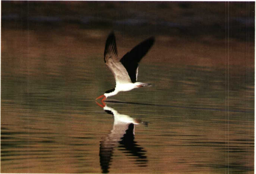
54 African Skimmer Rynchops flavirostris , Egypt, June 1987

at Kom Ombo (Nico de Haan pers comm). Presumably, these records involve Sudanese birds dispersing northwards. The only known recent report from the Red Sea is of one bird at Hurghada on 15 May 1982 (Goodman & Meininger). I thank Peter Meininger for his help in preparing this note.