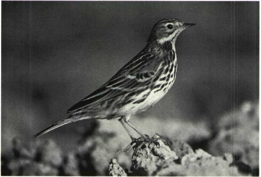
57-58 Red-throated Pipit Anthus cervinus , adult, Israel, November 1985