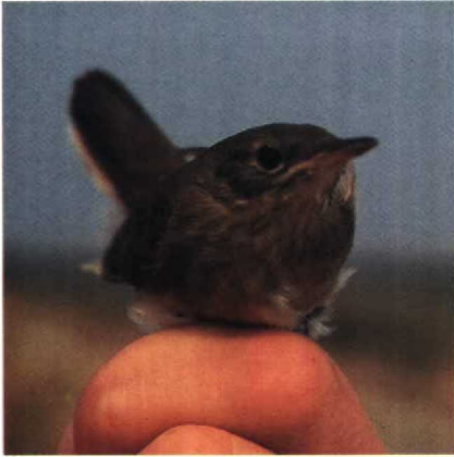
48 Savi's Warbler Locustella luscinioides with streaked breast, Greece, August 1987