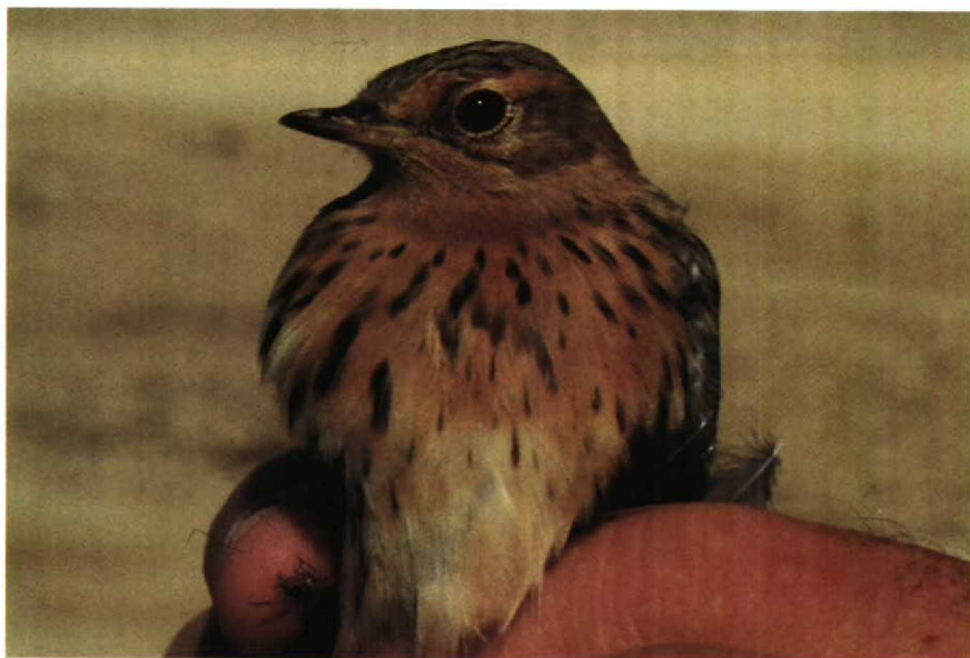
55-56 Red-throated Pipit Anthus cervinus , adult, Israel, October 1985