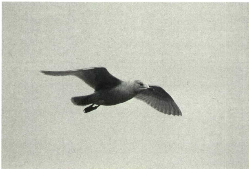
59-60 Thayer's Gull Larus thayeri , Galway, County Galway, Ireland, March 1989