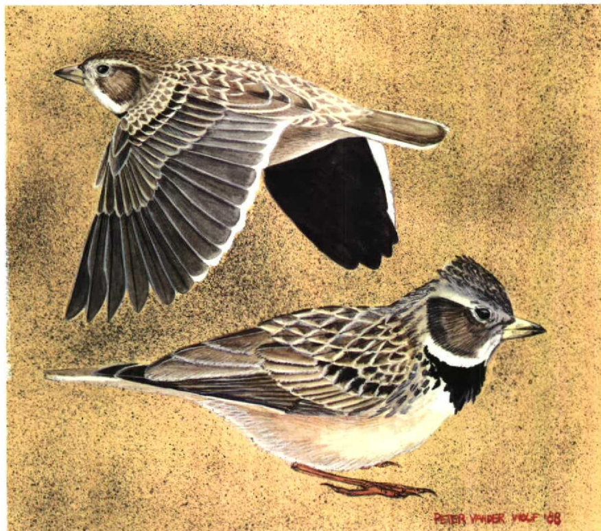
FIGUUR 1 Kalendarleeuwerik Melanocorypha calandra (Peter van der Wolf)

STAART Buitenste staartpennen voor zover zichtbaar geheel wit, overige met witte eindzomen, behalve binnenste; deze geheel donkerbruin.