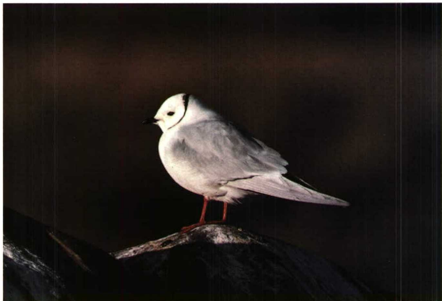
61-62 Ross's Gull Rhodostethia rosea , Churchill, Manitoba, Canada, July 1988