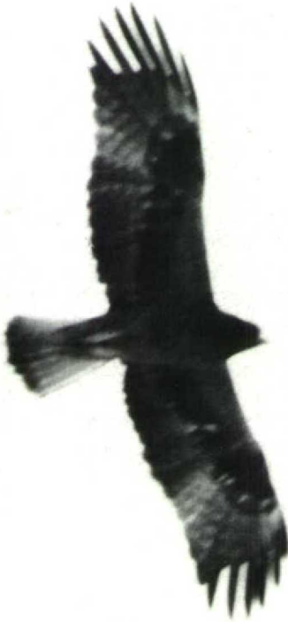
44 Booted Eagle Hieraetus pennatus rufous morph, Elat, Israel, March 1976

dian underwing-coverts and undertail-coverts similarly or even paler rufous. The greater underwing-coverts and under primary coverts were dark brown, forming a dark band across the underwing, a pattern similar to that of juvenile or immature Bonelli's Eagle H fasciatus . Head, upperparts, upperwing and tail were identical in all individuals, regardless of morph.