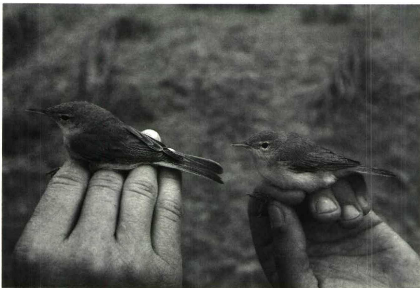
Mystery photograph 32. Solution in next issue