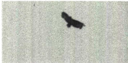
53 Bastaardarend Aquila clanga , Terschelling, Friesland, mei 1985