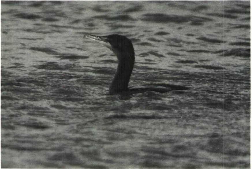
65 Double-crested Cormorant Phalacrocorax auritus , Billingham, Cleveland, Great Britain, February 1989 66 Grey-headed Gull Larus cirrocephalus , Elat, Israel, March 1989