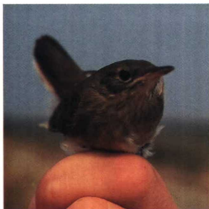
48 Savi's Warbler Locustella luscinioides with streaked breast, Greece, August 1987