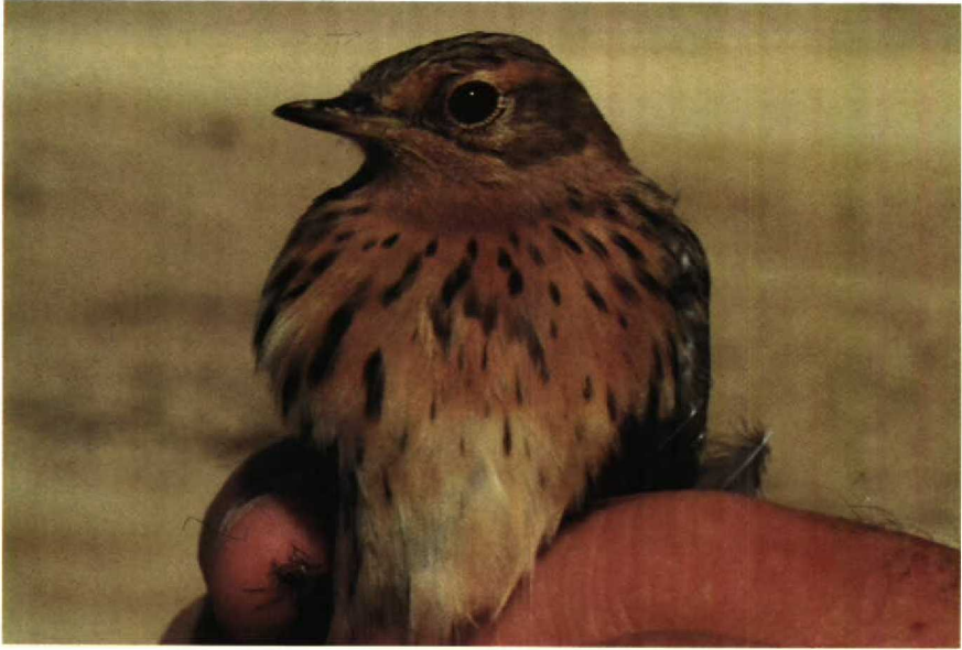
55-56 Red-throated Pipit Anthus cervinus , adult, Israel, October 1985 (Per Alström)