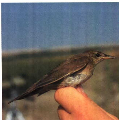
49 Savi's Warbler Locustella luscinioides with normal breast, Greece, August 1987