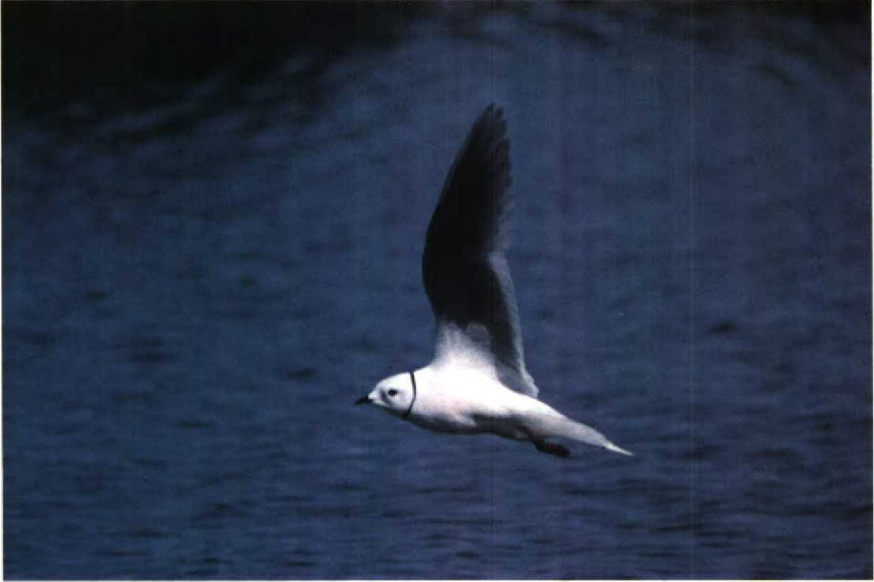
63 Ross's Gull Rhodostethia rosea , Churchill, Manitoba, Canada, July 1988 ( Peter Scova-Righini ) 64 Ross's Gull Rhodostethia rosea with two Bonaparte's Gulls Larus philadelphia , Churchill, Manitoba, Canada, July 1988 ( Peter Scova-Righini )