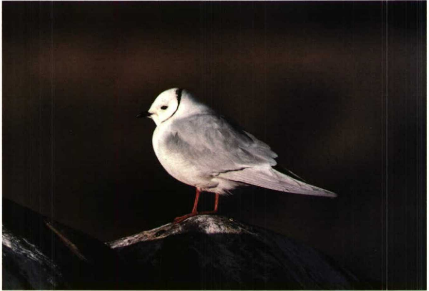
61-62 Ross's Gull Rhodostethia rosea , Churchill, Manitoba, Canada, July 1988 (Peter Scova-Righini)