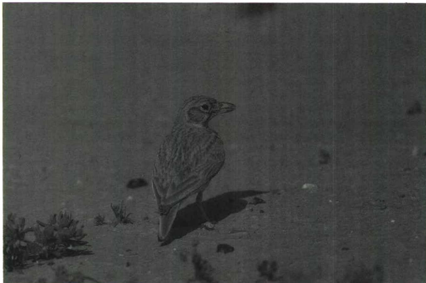
67 Dunn's Lark Eremalauda dunni , Arava valley, Israel, spring of 1989

less than 120 Houbara Bustards Chlamydotis undulata and six Arabian Bustards Ardeotis arabs were reported to be killed in the Merzouga area by Saudi Arabian falconers in December 1988. Three surviving Arabian Bustards were located in the area in early January, while another was spotted at Daya-el-Maïder on 1 January. At least 36 Great Bustards Otis tarda were assembling at Asilah Marsh in February; these birds probably belong to a small resident population in northern Morocco. On 14 March, in the Negev, Israel, a flock of 25 Caspian Plovers Charadrius asiaticus was sighted. The three Merja Zerga, Morocco, Slender-billed Curlews Numenius tenuirostris were reported to be present to at least 9 February, while at least one stayed until 11 March. An (oiled) Sabine's Gull Larus sabini flew past Oostende, Westvlaanderen, on 10 January, providing Belgium's first winter record. The long-staying Bonaparte's Gull L. philadelphia of IJmuiden, Noordholland, Netherlands, had