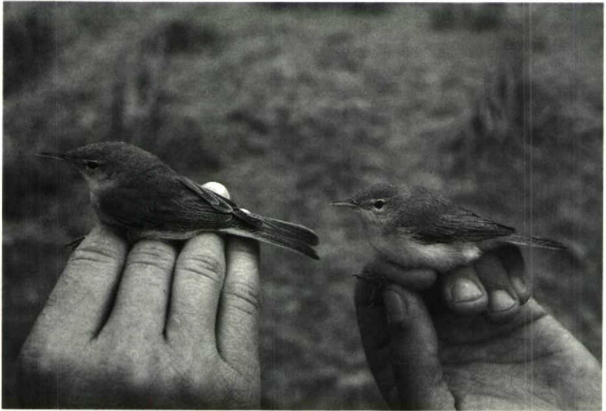
Mystery photograph 32. Solution in next issue