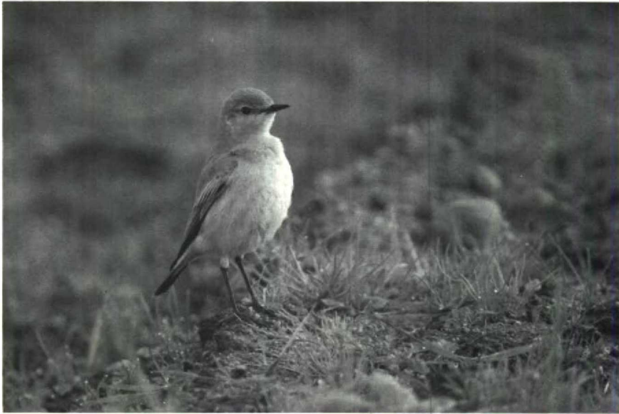
23 Isabelline Wheatear Oenanthe isabellina , Isles of Scilly, Great Britain, October 1988 (David M Cottridge)

ford Warbler Sylvia undata for 1988 was at Zeebrugge from 30 October to 1 November. A Desert Warbler S nana near Aerdenhout, Noordholland, from 30 October to 4 November excited 100s of Dutch and Belgian birders and was the first for the Netherlands. Up to five Azure Tits Parus cyanus were present at Kuhmo, Finland, from 27 November to at least 6 December. During September-October at least eight Red-eyed Vireo's Vireo olivacea were recorded in Britain and Ireland, and with two on St. Mary's on 10 October. On 7 October, Fair Isle produced a Blackburnian Warbler Dendroica fusca . This would be the first WP record of this warbler which breeds in eastern North America. A Northern Waterthrush Seiurus noveboracen-