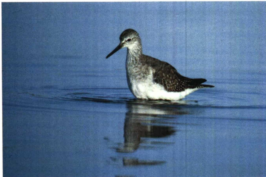
2 Kleine Geelpootruiter Tringa flavipes , Oosterland, Zeeland, november 1979 (Henk Harmsen)

Poelruiter voorhoofd, voorhals en borst in november vrijwel wit zijn en de poten vrij donker (hoewel soms heldergeel in het voorjaar) en dat de gele kleur aan de snavelbasis ontbreekt. Juveniele Tureluurs hebben soms een geelachtige snavelbasis en poten maar het gekleurde deel van de snavel is veel uitgebreider dan bij de Kleine Geelpoot en omvat eenderde tot de helft van de snavellengte. Bij Bosruiter en Witgatje is de tekening van de bovendelen in elk kleed ongeveer even levendig als die op de dekveren en tertials. De Bosruiter heeft bovendien een duidelijke, ver voorbij het oog doorlopende, scherp afgezette wenkbrauwstreep. De poten van het Witgatje zijn altijd vrij donker groenachtig, die van de Bosruiter soms opvallend geel, gewoonlijk echter groen- of bruinachtig geel. Het winterkleed van de Grote Geelpootruiter heeft veel weg van dat van de Kleine. Bovendelen, borst en flank zijn echter gewoonlijk wat sterker getekend. Eenderde deel van de snavel vanaf de basis is bij de Grote Geelpoot vrij licht groen-, grijs- of geelachtig.