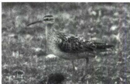
6-7 Little Whimbrel Numenius minutus , Yamdena, Tanimbar Islands, Indonesia, September 1985 (Frank G Rozendaal) 8 Little Whimbrel Numenius minutus , Norfolk, Great Britain, August 1985 (David M Cottridge)

30 Plumage pattern and size and shape of the bill of the bird depicted in mystery photograph 30 only fit the two small curlews, Little Whimbrel Numenius minutus and Eskimo Curlew N borealis , and Upland Sandpiper Bartramia longicauda . The bill seems conclusive for Upland Sandpiper, being straight and rather short. However, the pale pinkish-brown base of the bill fits one of the curlews better than Upland Sandpiper, which has bright yellow or yellowish-brown sides to the bill. Moreover, Upland Sandpiper has the upperparts less coarsely marked than the mystery bird and lacks the pronounced dark eye-stripe, having a prominent large dark eye on a pale yellow-buff face instead. Eskimo Curlew also shows a less pronounced supercilium and eye-stripe than the mystery bird. The markings of the head, neck and upperparts, in combination with the bill colour, only fit Little Whimbrel. The fact that the bill appears to be too short and straight for this species is explained by the tip hav-