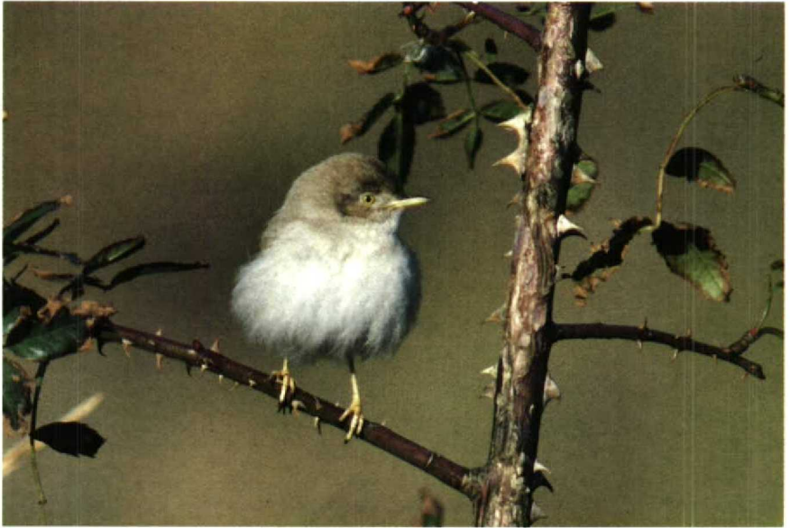
38-39 Woestijngrasmus Sylvia nana , Amsterdamse Waterleidingduinen, Noordholland, november 1988