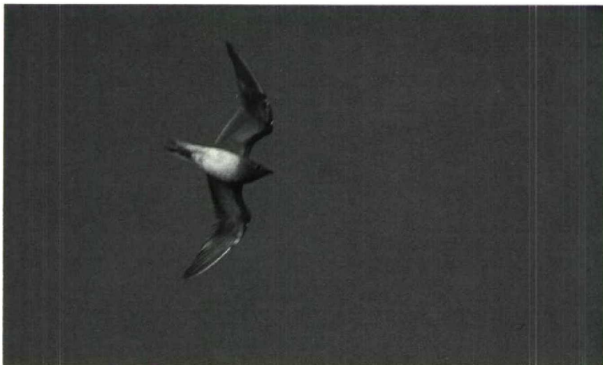
11 Vorkstaartplevier Glareola pratincola , Terneuzen, Zeeland, november 1987

onderdekveren kastanjekleurig. Voorrand ondervleugel bruinzwart.