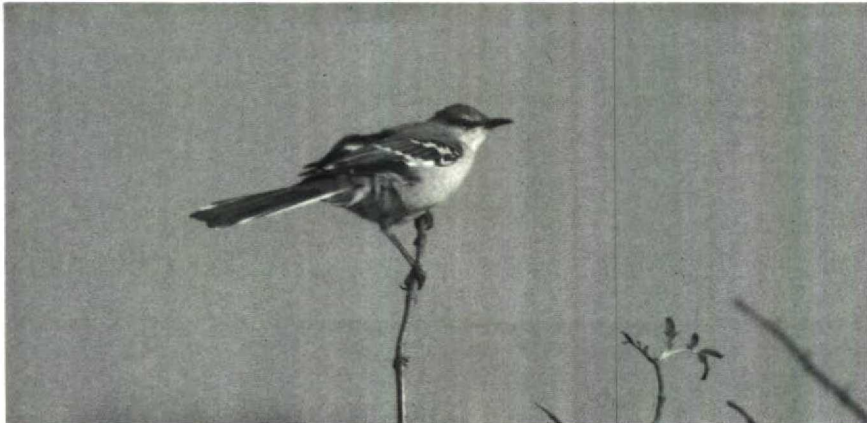
37 Spottlijster Mimus polyglottos , Schiermonnikoog, Friesland, oktober 1988

Oostende, tussen 16 en 30 oktober enkele op Texel, op 18 oktober een vondst bij Raversijde, op 26 en 27 oktober bij Ritthem Z, op 6 november bij den Oever en op 5 en 6 december bij Katwijk Zh. Na een lange aan-