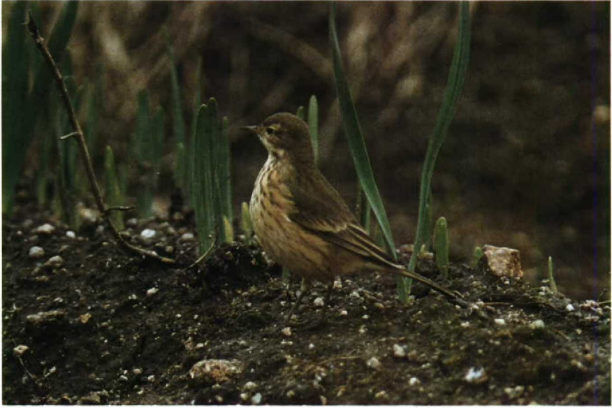
20 American Pipit Anthus rubescens , Isles of Scilly, Great Britain, October 1988 (David M Cottridge) 21 Northern Oriole Icterus galbula , Isles of Scilly, Great Britain, October 1988 (Pete Wheeler) 22 Red-eyed Vireo Vireo olivaceus , Isles of Scilly, Great Britain, October 1988 (David M Cottridge)