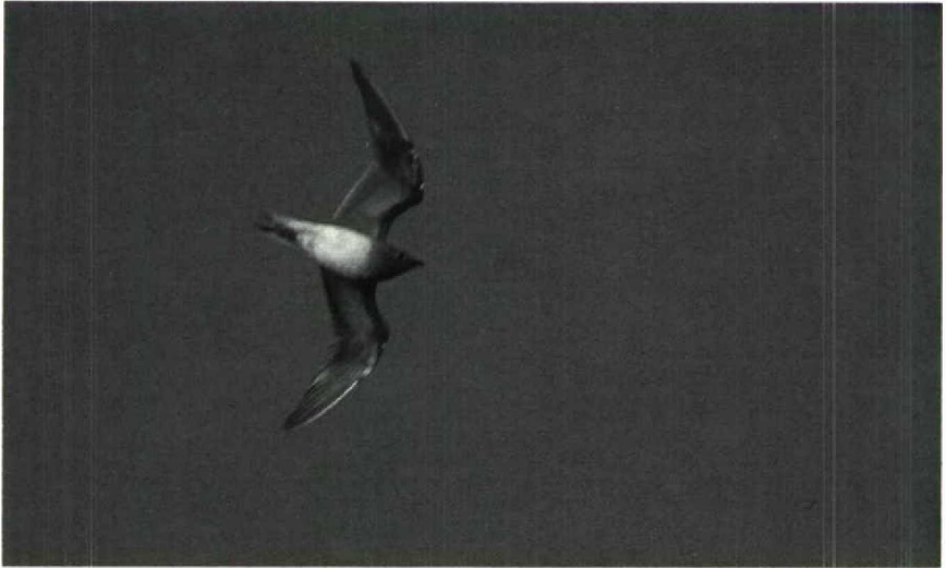
11 Vorkstaartplevier Glareola pratincola , Terneuzen, Zeeland, november 1987

onderdekveren kastanjekleurig. Voorrand ondervleugel bruinzwart.