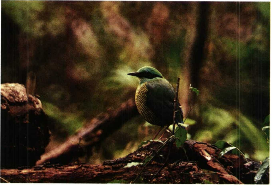
4 Elliot's Pitta ellioti , male, Kon Ha Nung forestry concession, Gia Lai-Kon Tum, Viet Nam, May 1988 (Frank G Rozendaal) 5 Elliot's Pitta ellioti , pair at nest, Kon Ha Nung forestry concession, Gia Lai-Kon Tum, Viet Nam, May 1988 (Frank G Rozendaal)