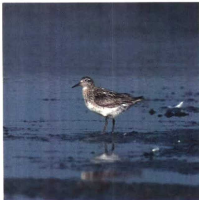
135-136 Siberische Strandloper Calidris acuminata , Philippine, Zeeland, september 1989

21 september bij Philippine. Breedbekstrandlopers Limicola falcinellus werden gemeld op 18 augustus bij Wissenkerke Z en op 26 augustus in het Lauwersmeer. Een zomerwaarneming van een Bokje Lymnocyptes minimus werd gedaan aan de Oostvaardersdijk op 22 juli. Een Poel-snip Gallinago media werd op 24 september kortstondig bij Zeebrugge geobserveerd. Een adulte Grote Grijs Snip Limnodromus scolopaceus werd op 27 juli gemeld in de Workumerwaard. Op 7 en 8 augustus zat een IJslandse Grutto Limosa limosa islandica in de Flaauwers Inlaag Z. Ook een groot aantal Poelruiters Tringa stagnatilis bereikte ons gebied. Vrijwel de gehele periode, tot 25 augustus en weer van 31 augustus tot 10 september, zat er één bij Kallo, op 4 juli bij de Vlinderbalg, op 4 en 5 juli langs de Oostvaardersdijk, op 7 juli op het Veerse Meer Z, op 16 juli op Texel, op 24 juli bij Sint-Philipsland Z, op 26 juli bij Nieuw Buinen, van 28 juli tot 20 augustus bij de Philipsdam, op 3 augustus bij Vlissingen, van 4 tot 6 augustus in het Lauwersmeer, op 7 augustus bij Harchies, op 27 augustus in de Oostvaardersplassen, op 5 september bij de Eemshaven en op 17 september op de Hellegatsplaten. Een Terekruiter Xenus cinereus werd op 22 juli gemeld langs de Knardijk. Tenminste 25