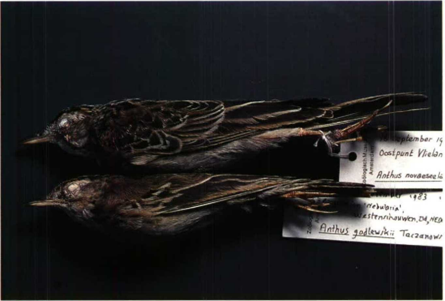
114 Blyth's Pipit Anthus godlewskii , first winter, November 1983 (lower), with Richard's Pipit A richardi (upper), collection ZMA (Arnaud B van den Berg) 115 Desert Warbler Sylvia nana nana , Amsterdamse Waterleidingduinen, Noordholland, November 1988 (Arnaud B van den Berg)