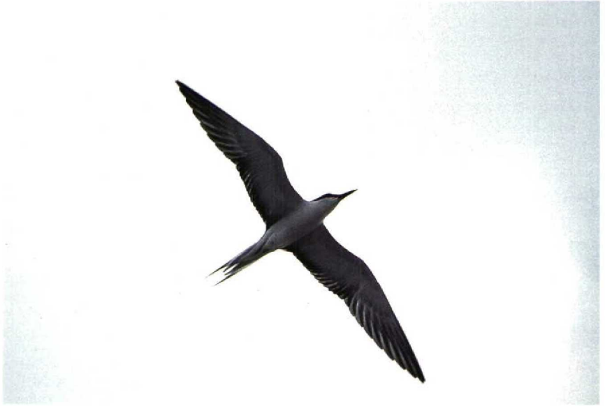
141 Brilsterne Sterna anaethetus , Terneuzen, Zeeland, juli 1989 ( René Pop ) 142 Brilsterne Sterna anaethetus , Philipsdam, Zeeland, juli 1989 ( Guus Hak )