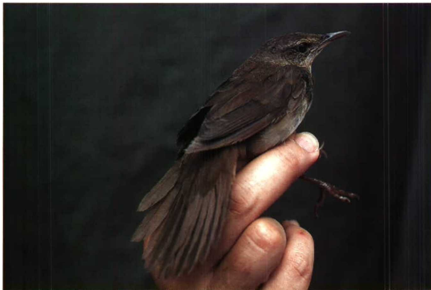
Mystery photograph 34. Solution in next issue.