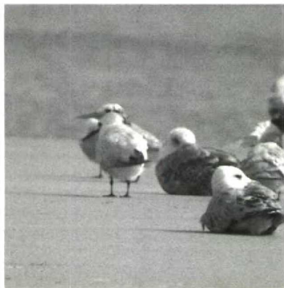
129 Royal Tern Sterna maxima , north of Agadir, Morocco, July 1988 (Arnold Meijer)

summer Sabine's Gull Larus sabini staying at Elat, Israel, from the last week of June to at least the end of July is worth mentioning. Three Royal Terns Sterna maxima were on a beach c 40 km north of Agadir, Morocco, on 14 July. Interestingly, an adult accompanied by a juvenile showed up at Tarifa, Spain, on 11 September. At Zeebrugge, Westvlaanderen, Belgium, an orange-