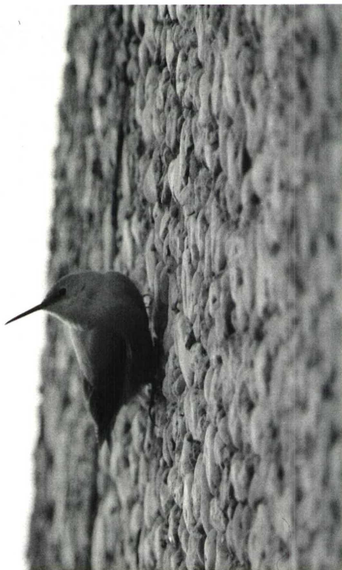
146 Vanaf 13 november 1989 verblijft een Rotskruiper Tichodroma muraria op het terrein van de Vrije Universiteit, Amsterdam Buitenveldert, Noordholland. Dit betreft het eerste geval van deze soort voor Nederland ( Arnoud B van den Berg )