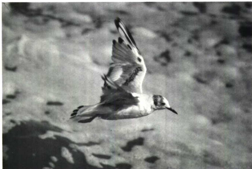
106 Kleine Kokmeeuw Larus philadelphia , IJmuiden, Noordholland, 9 juli 1988, ruiscore c 27 (Dieter Oelkers)

bruin met vrij brede witachtige rand; mogelijk één van tertials lichtgrijs. Grote en vermoedelijk meeste middelste dekveren egaal neutraalgrijs, ongeveer even licht als mantel. Kleine en vermoedelijk enkele middelste dekveren zwartbruin, zowel in zit als in vlucht opvallende diagonale armbaan vormend; diagonale armbaan duidelijk lichter (bruiner) dan zwartachtige partijen op handvleugel maar donkerder dan armbaan bij Kokmeeuw in eerste zomerkleed; in zit diagonale armbaan aan uiteinden breedst, in midden bijna onderbroken. Kleinste dekveren egaal lichtgrijs. Grote, middelste en kleine handdekveren wit; zwarte vlek op buitenste grote en middelste middelste handdekveren, daardoor buitenhand bonte aanblik gevend.