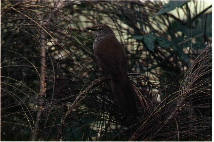
117-118 Java Russet Scrub Warbler Bradypterus seebohmi montis , Gunung Bromo, East Java, Indonesia, 2100 m, June 1989 (Frank G Rozendaal)