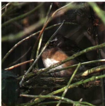
111 Eye-browed Thrush Turdus obscurus , Texel, Noordholland, October 1988

River Warbler Locustella fluviatilis 4,1 ZUIDHOLLAND Vlaardingen, 24-25 May, male, photographed and sound-recorded (W Breedveld, M Berlijn et al, van der Burg et al 1988, Lichtenbeld 1988). This is the 12th record for the Netherlands; all except the first three records were of singing birds in spring.