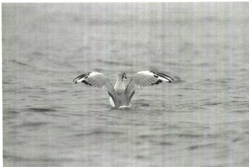
107 Kleine Kokmeeuw Larus philadelphia , IJmuiden, Noordholland, 20 juli 1988, ruiscore c 37 108 Kleine Kokmeeuw Larus philadelphia , IJmuiden, Noordholland, 8 augustus 1988, ruiscore c 44