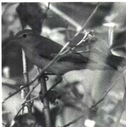
143 Bergfluit Phylloscopus bonelli , Maasvlakte, Zuidholland, september 1989

Lier waargenomen. Cetti's Zangers Cettia cetti werden gevangen op 17 en 18 september bij Veurne Wvl en op 18 september bij Diksmuide Wvl en gezien van 31 juli tot 2 september bij Harchies en op 18 september bij Zeebrugge. Een spectaculaire vangst was die van een Siberische Snor Locustella certhiola op 28 september in Het Zwin. Dit was het eerste geval voor de Benelux. Tevens werd weer een groot aantal Waterrietzangers Acrocephalus paludicola gevangen in België; tussen 4 en 19 augustus c 90 bij Zeebrugge en c 50 bij Veurne (tegen de 200 in totaal in België). Waarnemingen van deze soort waren bij de Westplaat van 6 tot 19 augustus, de Knardijk op 13 augustus, de Eemshaven op 16 augustus, Colijnsplaat Z op 19 augustus, Lier op 23 augustus, het Jaap Deensgat op 25 augustus, de Zevenhuizerplas op 1 september, in de AW-duinen op 3 september en in de Dintelhaven op 4 september. Na een vangst op 14 juni werden bij de zuiderburen nog eens drie Veldrietzangers A agricola in de netten aangetroffen; op 2 en 24 september bij Knokke Wvl en op 8 september bij Mont-Saint Guibert B. Enkele dagen voor 7 september werd in de Kennemerduinen een Orpheusspotvogel Hippolais polyglotta gevangen en eind augustus ook twee bij Zuienkerke. Bij Knokke was het op 21 sep-