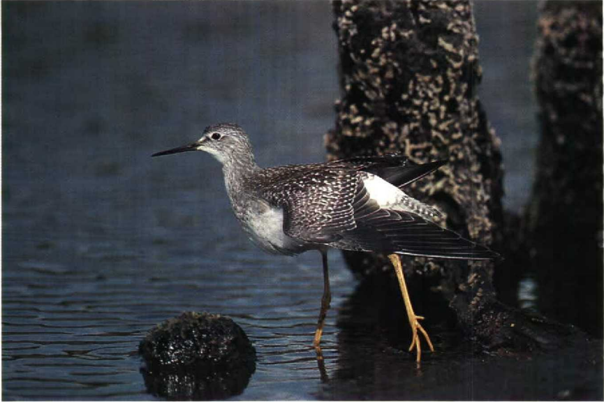
127 Lesser Yellowlegs Tringa flavipes , Drift Reservoir, Cornwall, Britain, August 1989 128 Blue-cheeked Bee-eater Merops persicus , Great Cowden, North Humberside, Britain, June 1989