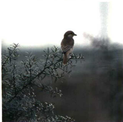
144 Izabelklauwier Lanius isabellinus , Zeebrugge, Westvlaanderen, september 1989 (Philip Bogaert)