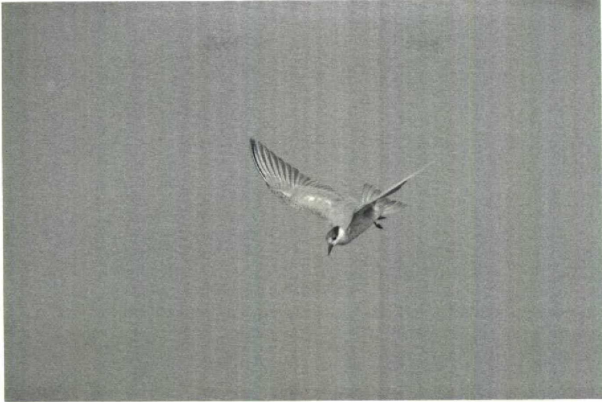
119 Whiskered Tern Chlidonias hybridus in adult winter plumage, Bangpoo, Thailand, March 1989 (Arnoud B van den Berg) 120 Whiskered Terns Chlidonias hybridus in adult winter (left) and adult summer (right) plumage, Bangpoo, Thailand, March 1989 (Arnoud B van den Berg)