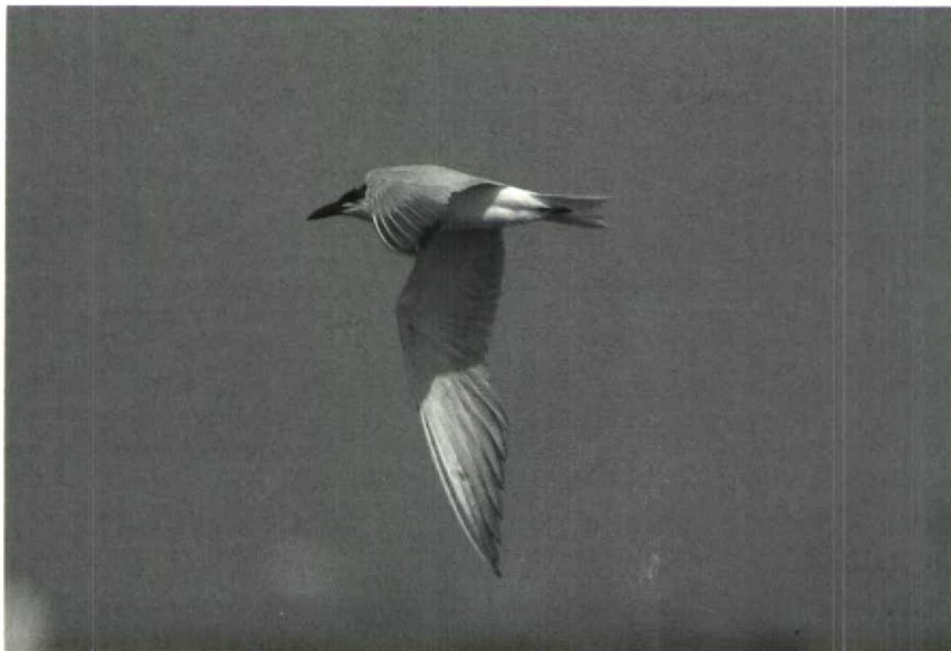
138 Lachstern Gelocheidon nilotica , Nieuwe Putten, Petten, Noordholland, augustus 1989

duin een Rosse Franjepoot P fulicarius langs. Op 27 augustus vlogen hier c 125 Kleine Jagers Stercorarius parasiticus langs. Een adulte Kleinste Jager S longicaudus vloog op 27 augustus bij Zeebrugge en op 29 augustus bij Westkapelle voorbij. Adulte Vorkstaartmeeuwen Larus sabini vlogen op 2 augustus langs Schiermonnikoog, op 15 augustus bij Katwijk en op 25 augustus bij Zeebrugge. Juvenielen verschenen op 30 augustus bij IJmuiden Nh en Zeebrugge, op 2 en 15 september bij Oostende, op 15 september bij Zeebrugge, op 17 september bij Camperduin en Scheveningen Zh en op 18 september bij Egmond aan Zee. Belangrijke aantallen Geelpootmeeuwen L cachinnans bleken aanwezig bij Terneuzen Z (in juli 35 à 40), bij Philippine (in september maximaal 30) en langs de Nederrijn Gld in augustus. Er waren gedurende de periode twee meldingen van Grote Burgemeesters L hyperboreus ; te Oostende op 31 juli en bij Zeebrugge op 27 augustus. Tussen 18 juli en 16 september