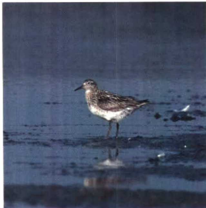
135-136 Siberische Strandloper Calidris acuminata , Philippine, Zeeland, september 1989

21 september bij Philippine. Breed- bekstrandlopers Limicola falcinellus werden gemeld op 18 augustus bij Wissenkerke Z en op 26 augustus in het Lauwersmeer. Een zomerwaarneming van een Bokje Lymnocyptes minimus werd gedaan aan de Oostvaardersdijk op 22 juli. Een Poel- snip Gallinago media werd op 24 september kortstondig bij Zeebrugge geobserveerd. Een adulte Grote Grijs Snip Limnodromus scolopaceus werd op 27 juli gemeld in de Workumerwaard. Op 7 en 8 augustus zat een IJslandse Grutto Limosa limosa islandica in de Flaauwers Inlaag Z. Ook een groot aantal Poelruiters Tringa stagnatilis bereikte ons gebied. Vrijwel de gehele periode, tot 25 augustus en weer van 31 augustus tot 10 september, zat er één bij Kallo, op 4 juli bij de Vlinderbalg, op 4 en 5 juli langs de Oostvaardersdijk, op 7 juli op het Veerse Meer Z, op 16 juli op Texel, op 24 juli bij Sint-Philipsland Z, op 26 juli bij Nieuw Buinen, van 28 juli tot 20 augustus bij de Philipsdam, op 3 augustus bij Vlissingen, van 4 tot 6 augustus in het Lauwersmeer, op 7 augustus bij Harchies, op 27 augustus in de Oostvaardersplassen, op 5 september bij de Eemshaven en op 17 september op de Hellegatsplaten. Een Terek- ruiter Xenus cinereus werd op 22 juli gemeld langs de Knardijk. Tenminste 25