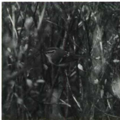
112 Pallas's Warbler Phylloscopus proregulus , Texel, Noordholland, October 1988

Booted Warbler Hippolais caligata 2,1 NOORDHOLLAND Kennemerduinen, 21 September, first calendar year, trapped and photographed (ringing group van Lennep, van den Berg 1989, van der Burg et al 1988). This is the third record for the Netherlands. The previous two were in October and also trapped.