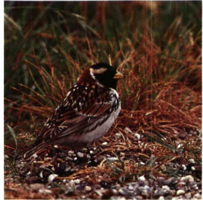
103 IJsgors Calcarius lapponicus , Putten bij Camperduin, Noordholland, juni 1989 (Hans Roersma)

lanceolatus bij Wageningen Gld op 10 en 11 mei werd korte tijd voor een Rosse Spotlijster Toxostoma rufum gehouden. Een Buidelmees Remiz pendulinus die op 30 april bij Schulen werd gecontroleerd bleek het vorig najaar als eerstejaars geringd te zijn bij Lier. Roodkopklauwieren Lanius senator waren er op 1 mei bij Blokkersdijk, op 10 mei bij Goudriaan, op 14 juni in het NP De Hoge Veluwe Gld en op 18 juni op Vlieland Fr. Een mogelijke Pallas' Roodmus Carpodacus roseus werd kort gezien bij Groningen. Van 18 mei tot in juni konden op enkele plaatsen in de Flevopolder weer Roodmussen C erythrinus waargenomen worden. Waarnemingen elders betreffen die van Texel op 21 en 27 mei, Den Helder