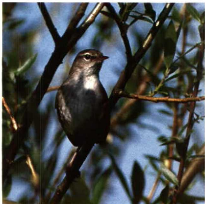
102 Cetti's Zanger Cettia cetti , Dordtse Biesbosch, Zuidholland, mei 1989