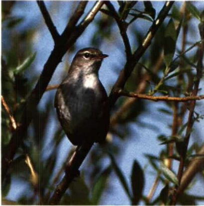
102 Cetti's Zanger Cettia cetti , Dordtse Biesbosch, Zuidholland, mei 1989