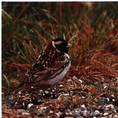
103 IJsgors Calcarius lapponicus , Putten bij Camperduin, Noordholland, juni 1989

lanceolatus bij Wageningen Gld op 10 en 11 mei werd korte tijd voor een Rosse Spotlijster Toxostoma rufum gehouden. Een Buidelmees Remiz pendulinus die op 30 april bij Schulen werd gecontroleerd bleek het vorig najaar als eerstejaars geringd te zijn bij Lier. Roodkopklauwieren Lanius senator waren er op 1 mei bij Blokkersdijk, op 10 mei bij Goudriaan, op 14 juni in het NP De Hoge Veluwe Gld en op 18 juni op Vlieland Fr. Een mogelijke Pallas' Roodmus Carpodacus roseus werd kort gezien bij Groningen. Van 18 mei tot in juni konden op enkele plaatsen in de Flevopolder weer Roodmussen C erythrinus waargenomen worden. Waarnemingen elders betreffen die van Texel op 21 en 27 mei, Den Helder