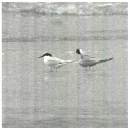
92 Dougalls Stern Sterna dougallii , IJmuiden, Noordholland, juni 1989 (Lammert van der Veen)

KRAANVOGELS TOT ALKEN Zeven Kraanvogels Grus grus , waaronder vijf adulten die af en toe ballsten, waren van 27 maart tot 15 april