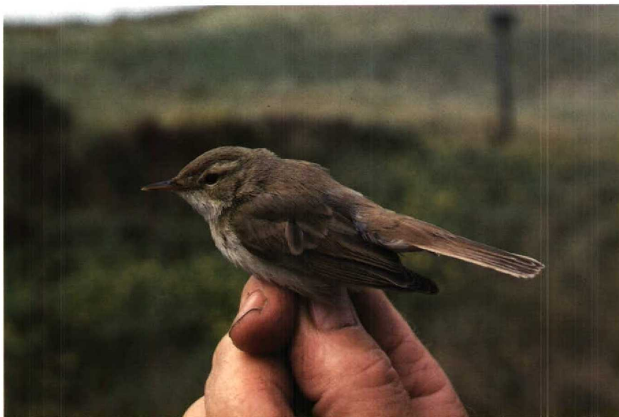
80 Kleine Spotvogel Hippolais caligata , Bloemendaal, Noordholland, september 1988

12:30 trof ik een kleine zanger aan in de bovenste baan van een mistnet tussen 2-6 m hoge wilgen en duindoorns. Vanwege het Fitis Phylloscopus trochilus -achtige voorkomen, het bleke uiterlijk, de achter het oog brede lichte wenkbrauwstreep, de witachtige staartzijde en de gladde licht rozeachtige poten kon de vogel onmiddellijk als Kleine Spotvogel Hippolais caligata worden herkend. De vogel werd geringd (Arnhem J04521), beschreven en gefotografeerd. Voordat de vogel om 14:00 bij het strandpaviljoen 'Parnassia' werd losgelaten, kon hij ook door de gewaarschuwde en tijdig gearriveerde Hans Schouten, Jan van Tussenbroek en Kees van Tussenbroek worden bekeken. De vogel vloog naar dicht struikgewas en liet zich urenlang niet meer zien. Om 17:30 waren er 12 vogelaars getuige van dat de vogel zich begon te verplaatsen waarbij hij even bovenin een struik, op de kale grond en op prikkeldraad ging zitten en enkele keren van struik naar struik vloog, om tenslotte na c 20 min over de duinen oostwaarts uit het zicht te verdwijnen. In zit vielen klein formaat en witte onderdelen op. In vlucht waren de bleke bruingrijze bovendelen, iets donkerdere lange staart en witachtige staartzijde opvallend. De onderstaande beschrijving werd van de vogel in de hand gemaakt.