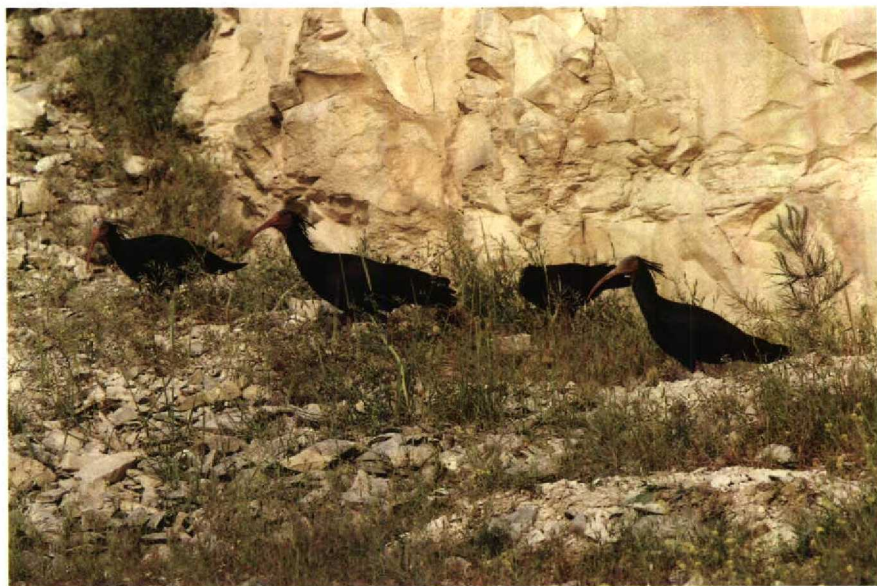
83-84 Bald Ibis Geronticus eremita , Birecik, Turkey, May 1987 (Arnoud B van den Berg)