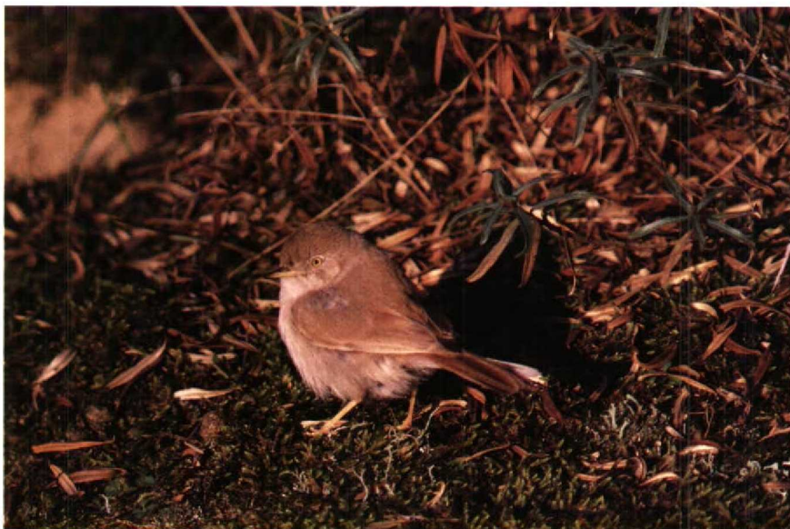
76 Woestijngrasmus Sylvia nana nana , Amsterdamse Waterleidingduinen, Noordholland, november 1988

STAART Licht afgerond. Buitenste staartpen wit, wit niet tot aan veerbasis doorlopend. Staartbasis en bovenstaartdekveren roodbruin (iets lichter dan bij Nachtegaal Luscinia megarhynchos ). Staartpennen met zeer