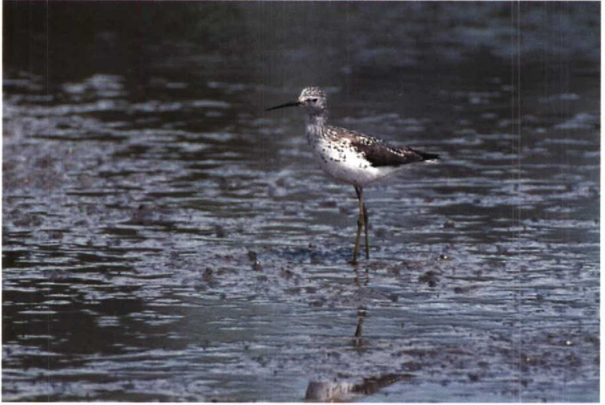
97 Poelruiter Tringa stagnatilis , Philipsdam, Zeeland, mei 1989 ( Hans Gebuis ) 98 Woestijntapuit Oenanthe deserti , Oud-Alblas, Zuidholland, april 1989 ( René van Rossum )