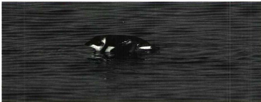
72 Kleine Alk Alle alle , Brouwersdam, Zuidholland, februari 1989 (René Pop)

der waren er exemplaren bij Valkenburg L op 30 en 31 januari en bij Loon D begin februari. De Cetti's Zanger Cettia cetti van Harchies Hg werd daar op 8 en 15 januari zingend aangetroffen. Siberische Tijftjaffen Phylloscopus colybitta tristis waren er op 1 januari in de Wieringermeer, op 22 januari in de Brabantse Biesbosch en van 27 januari tot 4 maart bij Harchies. De Rotskruiper Tichodroma muraria werd dit jaar laat ontdekt bij Poulseur Lk en trok tussen 12 en 28 maart veel belangstelling. Taiga-boomkruipers Certhia familiaris werden gemeld in het Amsterdamse Bos Nh op 2 en 5 januari (zingend), tussen 23 en 26 februari op Schiermonnikoog en op 20 maart op Texel (zingend). Bij Kallo overwinterden