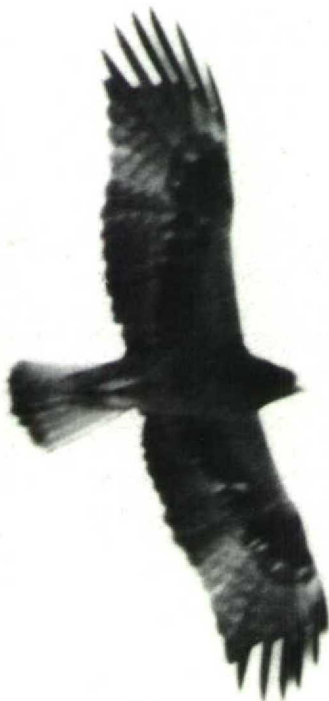
44 Booted Eagle Hieraetus pennatus rufous morph, Elat, Israel, March 1976

dian underwing-coverts and undertail-coverts similarly or even paler rufous. The greater underwing-coverts and under primary coverts were dark brown, forming a dark band across the underwing, a pattern similar to that of juvenile or immature Bonelli's Eagle H fasciatus . Head, upperparts, upperwing and tail were identical in all individuals, regardless of morph.