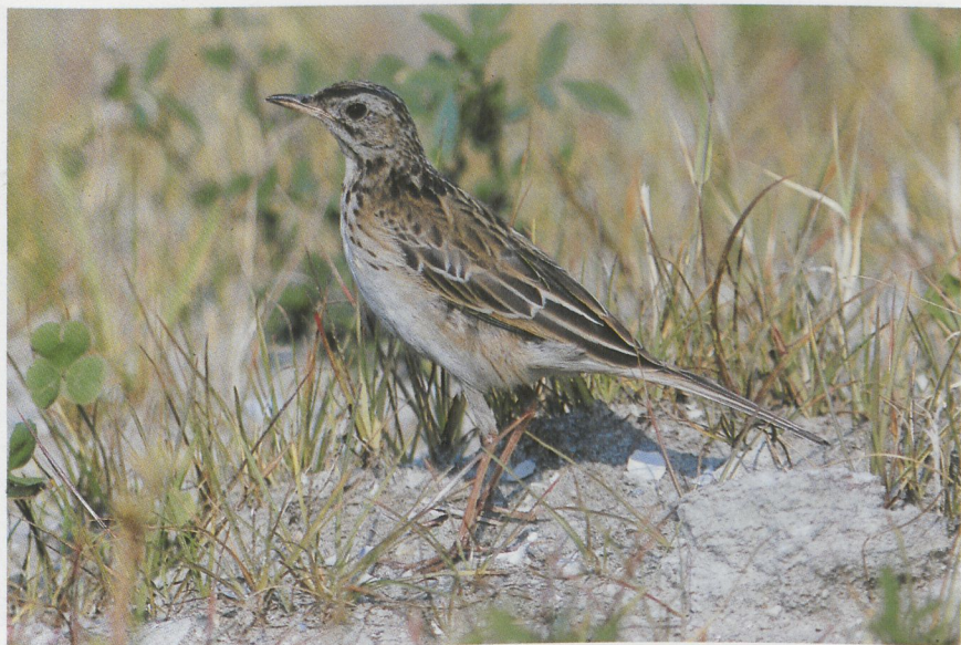
29 Grote Pieper Anthus richardi , Maasvlakte, Zuidholland, oktober 1987 30 Siberische Boompieper Anthus hodgsoni , Texel, Noordholland, oktober 1987