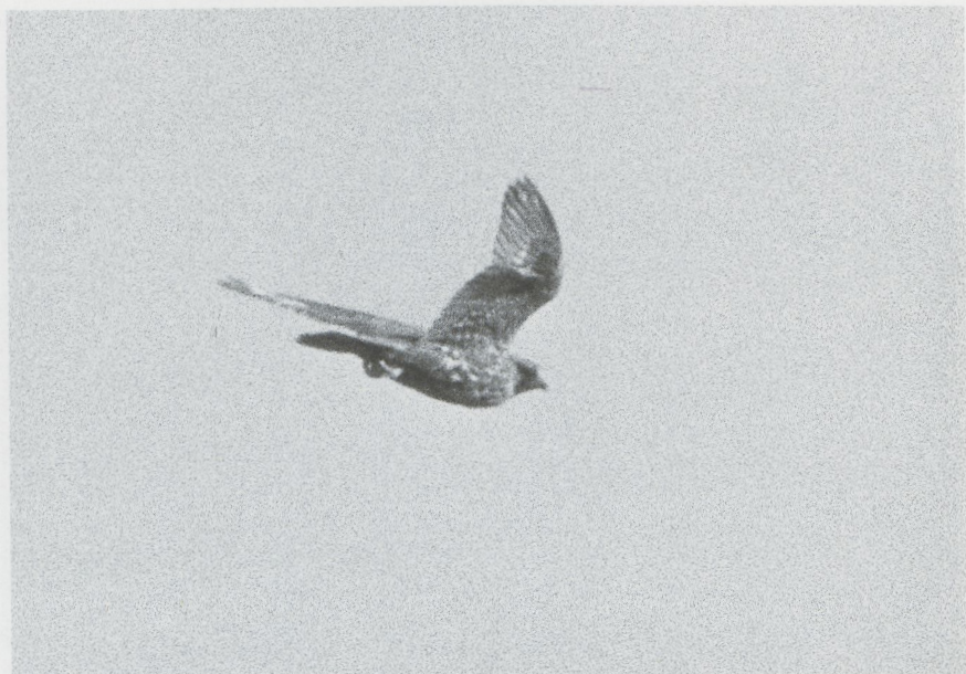
12 Giervalk Falco rusticolus , Eemshaven, Groningen, februari 1987

lichte zomen. Onderdelen crèmewit met zware grauwbruine lengtestrepen, op bovenborst losjes beginnend, naar onderen toe snel dichter wordend. Flank en buik zwaar gestreept; veren van zwaarst gestreepte gedeelte vrijwel geheel donker met smal roomwit randje. Anaalstreek roomwit met vage streepjes.