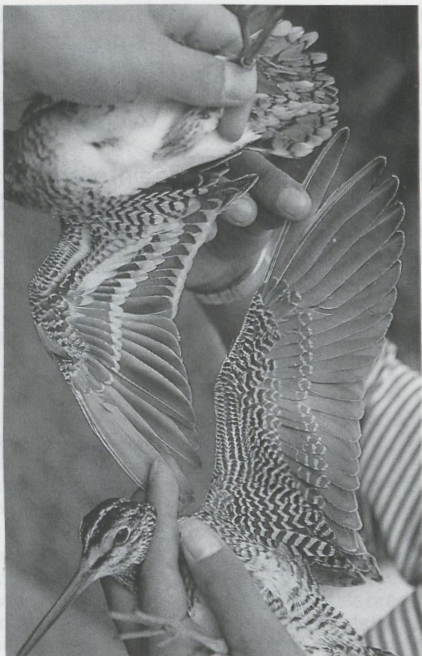
9 Swinhoe's Snipe Gallinago megala , Japan, September 1983 (Kiyooki Ozaki) 10 Common Snipe Gallinago gallinago (top) and Swinhoe's Snipe G. megala (bottom), Japan, September 1983 (Kiyooki Ozaki)

The snipe trapped at Eilat in November 1984 showed all the classic features of Pintail Snipe mentioned above. It was a first-winter bird, judging from the sandy tips to the outer primaries, the presence of juvenile coverts between the moulted adult-type feathers and the remiges that were all of the same age (cf Prater et al. ).