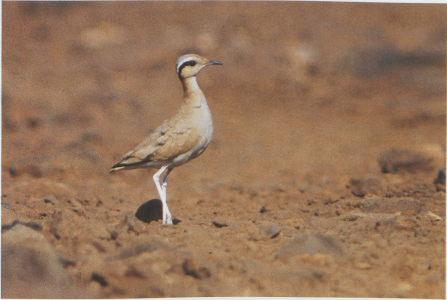
20 Cape Verde Islands Courser Cursorius cursor exsul, Santiago, Cape Verde Islands, February 1986