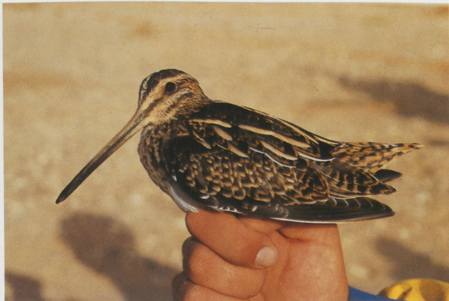
2 Common Snipe Gallinago gallinago , Israel, November 1985 (Hadoram Shirihai) 3 Great Snipe Gallinago media , Israel, September 1985 (Hadoram Shirihai)