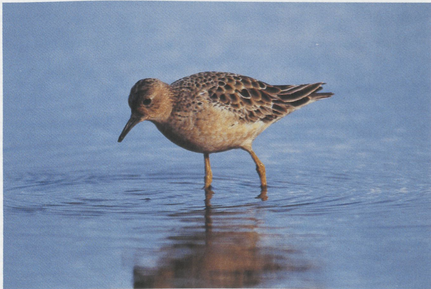
19 Blonde Ruiters Tryngites subruficollis , Lisse, Zuidholland, augustus 1986 (Arie de Knijff)

Hoewel Blonde Ruiters doorgaans kleiner zijn dan Kemphenen (ongeveer zo groot als een Drieteenstrandloper Calidris alba ), kunnen de kleinste Kemphenen toch net zo klein zijn als de grootste Blonde Ruiters. Belangrijkere kenmerken dan het formaat waren dan ook het okerkleurige gezicht met lichte partij rond het oog, de okerkleurige onderdelen met fijne donkere vlekjes op de zij-