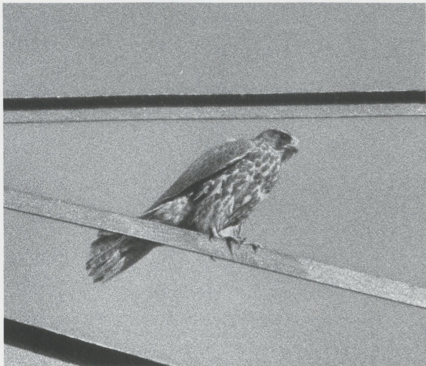
11 Giervalk Falco rusticolus , Eemshaven, Groningen, februari 1987 (Hans Gebuis)

soms op Fazanten Phasianus colchicus . Eenmaal joeg hij een Torenvalk na. Viermaal kon een geslagen prooi worden gedetermineerd; het betrof een Wilde Eend, een Fazant, een Patrijs Perdix perdix en een Graspieper Anthus pratensis .