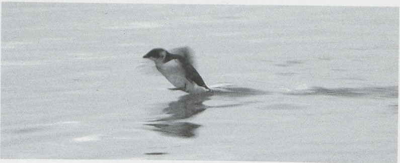
32 Kleine Alk Alle alle , IJmuiden, Noordholland, november 1987

GIERZWALUWEN TOT TROEPIALEN Nadat op 20 oktober boven het Westduinpark Zh en op 23 oktober bij Utrecht U al een Alpengierzwaluw Apus melba werd gezien verscheen het eerste voor velen tikbare exemplaar op 28 en 29 oktober bij Wormerveer. Tussen 6 november en 10 december wist een Hop Upupa epops zich in leven te houden in de omge-