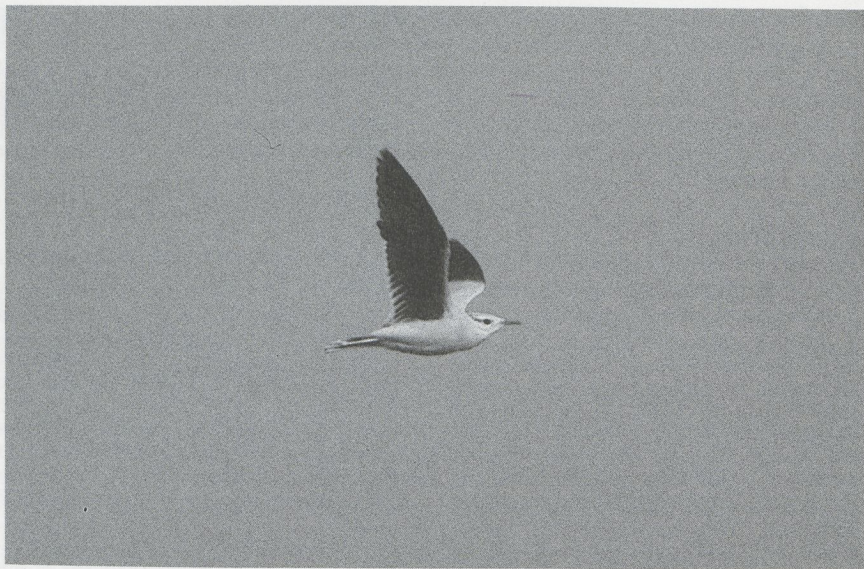
15 Renvogel Cursorius cursor , Camperduin, Noordholland, oktober 1987 (René Pop)

De Renvogel werd bij het foerageren regelmatig door Kieviten en Kokmeeuwen achterna gezeten en vloog dan vaak op. Bij het overvliegen van een Kievit en van een Knobbelzwaan Cygnus olor drukte de vogel zich plat tegen de grond. Af en toe woelde hij met de borst en buik wat grond los alvorens te gaan zitten. Dit gedrag werd ook waargenomen toen hij 's avonds bij het donker worden ging slapen.