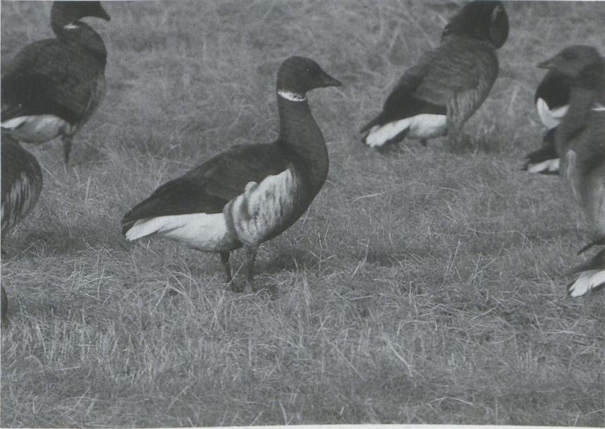
24 Zwarte Rotgans Branta bernicla nigricans , Grevelingendam, Zeeland, december 1987 (Hans Gebuis)

bleef er een in de Kievitslanden Fl. Flamingo's Phoenicopterus ruber roseus werden gezien tussen het Dijkwater Z en de Grevelingendam Z (twee) en in de Flaauwers Inlagen Z (drie), vergezeld door Chileense Flamingo's P chilensis . De eerste Dwerggans Anser erythropus van het winterseizoen werd op 14 november opgemerkt bij Anjum Fr. Andere exemplaren volgden op 5 december bij Zandvliet A, op 6 en 28 december aan de Strandgaperweg Fl, op 17 december bij Zuid-Beijerland Zh, op 19 en 30 december bij Damme Wvl en op 20 december bij Doel A. Twee Ross' Ganzen A rossii die van 25 tot 27 oktober in de achterhaven bij Zeebrugge verbleven, werden op 19 december herontdekt bij Damme. Witbuikrotganzen Branta bernicla hrota waren present op Wieringen Nh van 18 tot 21 november, in het Veerse Meer Z op 14 en 15 december (drie) en bij Scheveningen Zh op 15 december. Op 9 november werd een Zwarte Rotgans B b nigricans gezien op Ameland Fr, op 15 november zat er een bij Bruinisse Z, van